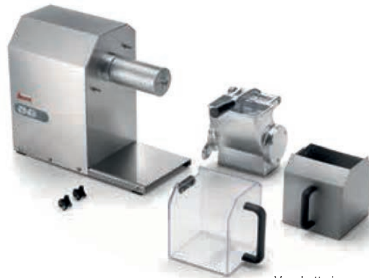
GFX HP 1.5-2