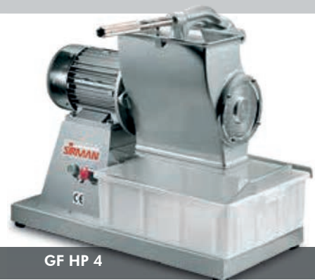
GF HP 4