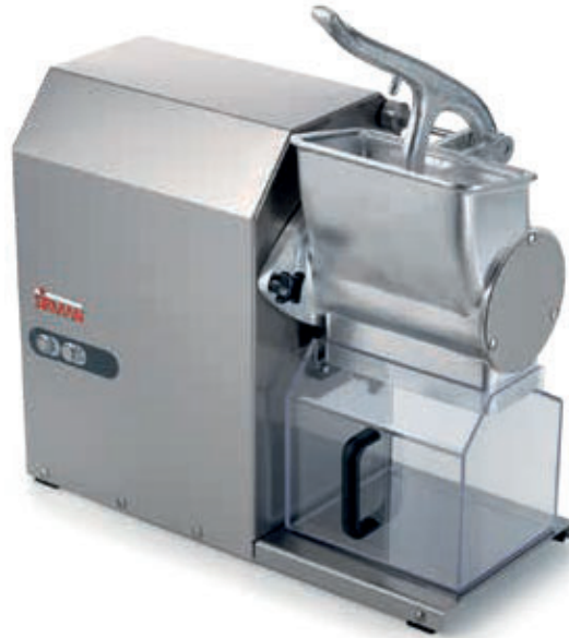
GFX HP 2

IP 54 protection rate 24V controls. Motor break. Safety microswitches on lever and receiving tray.