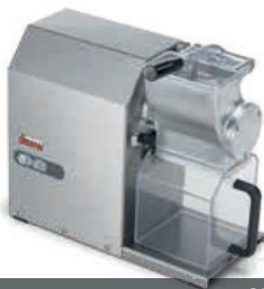
GFX HP 1,5