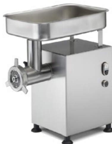
La Minerva A/E 12 - 22 - 32