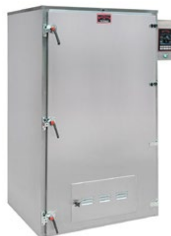
ΒΕΕΛΟΝΙΑ F5 ΞΗΡΑΝΤΗΡΙΟ ΚΑΙ ΚΑΠΝΙΣΤΗΡΙΟ ΛΟΥΚΑΝΙΚΩΝ