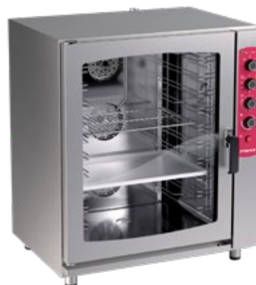
PRIMAX EASY LINE ΗΛΕΚΤΡΙΚΟΣ ΦΟΥΡΝΟΣ ΧΩΡΗΤΙΚΟΤΗΤΑ ΔΟΧΕΙΟΥ 5 , 7, 12 GN1/1