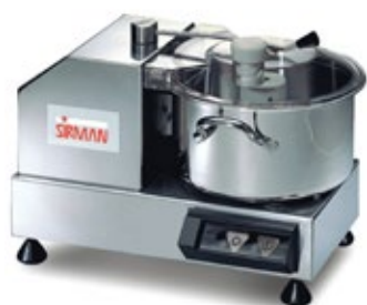
SIRMAN C ΧΩΡΗΤΙΚΟΤΗΤΑ 4-6-9 lt