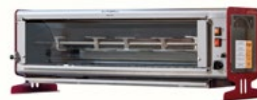
ELANGRILL Elba 6P ΑΕΡΙΟΥ Χωρητικότητα μέχρι 6 τεμάχια του 1 κιλού