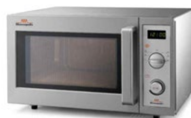
MINNEAPOLIS WP ΧΩΡΗΤΙΚΟΤΗΤΑ 25 lt