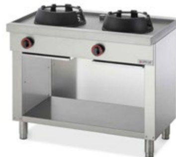
WOK DRAGONE DG702 ΑΕΡΙΟΥ / 2ΠΛΗ