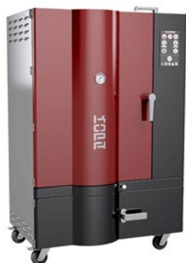
ΚΟΡΑ ΦΟΥΡΝΟΣ ΚΑΠΝΙΣΜΑΤΟΣ