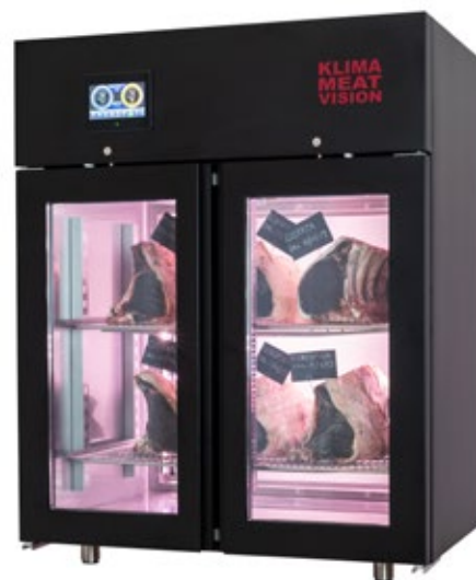
ZERNIKE KMVS BLACK ΩΡΙΜΑΝΤΗΡΙΟ ΚΡΕΑΤΩΝ ΧΩΡΗΤΙΚΟΤΗΤΑ 50-120 lt