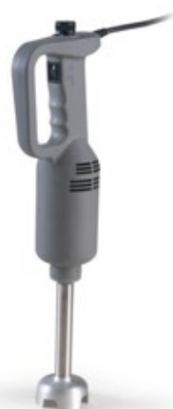
SIRMAN STORM 25-35 cm ΜΠΑΡΑ