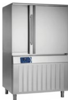
FRIULINOX GO BF122 ΤΑΧΕΙΑΣ ΨΥΞΗΣ 50, 72 kg ΒΑΘΥΑΣ ΤΑΧΕΙΑΣ ΨΥΞΗΣ 32, 48 kg