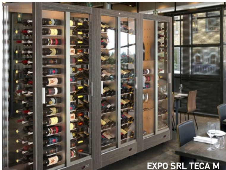
EXPO SRL TECA M