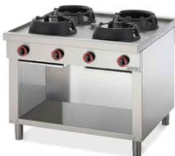
WOK DRAGONE DG1104 ΑΕΡΙΟΥ / 4ΠΛΗ