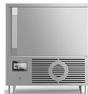
FRIULINOX BOOSTER BF051 AB ΤΑΧΕΙΑΣ ΨΥΞΗΣ 18 kg ΒΑΘΥΑΣ ΤΑΧΕΙΑΣ ΨΥΞΗΣ 12 kg