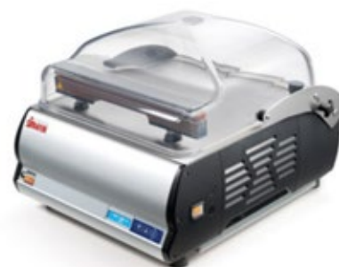
SIRMAN W8 (ΤΥΠΟΥ ΚΑΜΠΑΝΑ) ΕΞΩΤΕΡΙΚΗΣ ΑΝΑΡΡΟΦΗΣΗΣ ΜΗΚΟΣ ΚΟΛΛΗΣΗΣ 30, 40 και 50 εκ.