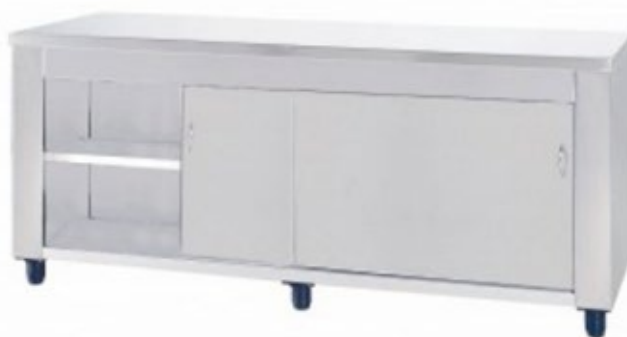
NI ERSY ΕΡΜΑΡΙΟ ΜΕ ΔΥΟ ΣΥΡΟΜΕΝΕΣ ΠΟΡΤΕΣ ΣΕ ΠΟΛΛΑ ΜΕΓΕΘΗ