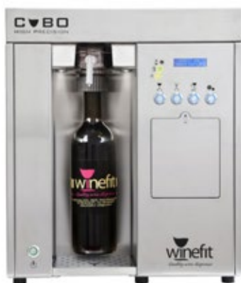
WINEFIT CUBO Διάσταση (Π x Β x Υ) 432x443x505 mm