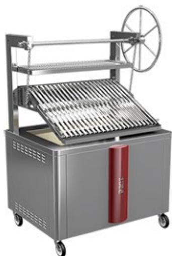
ΚΟΡΑ PARILLA 130S ΨΗΣΤΑΡΙΑ-ΣΧΑΡΑ ΜΕ ΡΥΘΜΙΖΟΜΕΝΗ ΚΛΙΣΗ