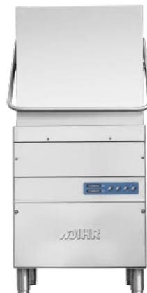
DIHR HT 11 Καλάθι mm 500x500