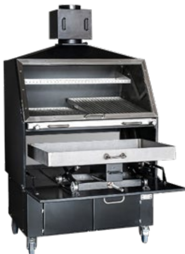
ELITXU 9000 ΦΟΥΡΝΟΣ ΚΑΡΒΟΥΝΟΥ Διαστάσεις σχάρας πλάτος x βάθος 2 X 500 X 660 mm