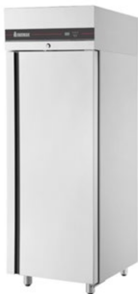
INOMAK CBP172 ΘΑΛΑΜΟΣ ΚΑΤΑΨΥΞΗΣ