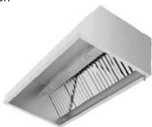
ΧΟΑΝΗ ΚΛΑΣΣΙΚΗ ΚΟΝΤΕΧ ΣΕ ΠΟΛΛΑ ΜΕΓΕΘΗ