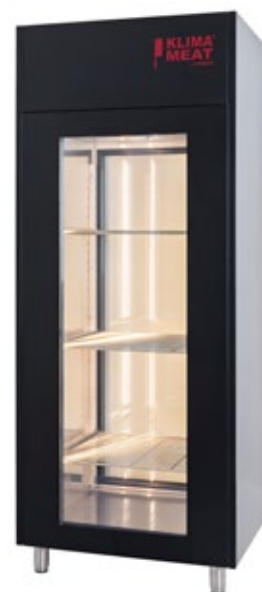
ZERNIKE KMSD 700 BLACK ΩΡΙΜΑΝΤΗΡΙΟ ΚΡΕΑΤΩΝ ΧΩΡΗΤΙΚΟΤΗΤΑ 50-130 lt