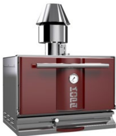
ΚΟΡΑ 300 ΦΟΥΡΝΟΣ ΚΑΡΒΟΥΝΟΥ ΔΙΑΣΤΑΣΗ ΨΗΣΤΑΡΙΑΣ mm 380 X 570 ΧΩΡΗΤΙΚΟΤΗΤΑ 10 Kgr ΚΡΕΑΣ/ΩΡΑ