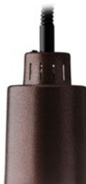
STAYHOT 27001 BRONZE