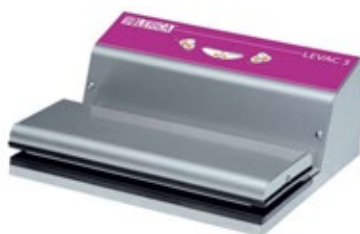
LERICA LEVAC 4 ΕΞΩΤΕΡΙΚΗΣ ΑΝΑΡΡΟΦΗΣΗΣ ΜΗΚΟΣ ΚΟΛΛΗΣΗΣ 30 και 40 εκ.