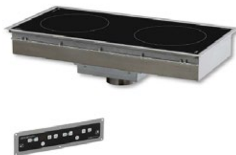
ADVENTYS GL2 FLR ΕΝΤΟΙΧΙΣΜΕΝΗ ΕΠΑΓΩΓΙΚΗ ΕΣΤΙΑ ΕΠΙΦΑΝΕΙΑ ΨΗΣΙΜΑΤΟΣ 600x325 mm