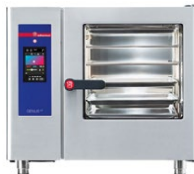
ELOMA GENIUS BACKMASTER 5BN ΗΛΕΚΤΡΙΚΟΣ ΦΟΥΡΝΟΣ ΧΩΡΗΤΙΚΟΤΗΤΑ ΤΑΨΙΩΝ 5 X (600X400)