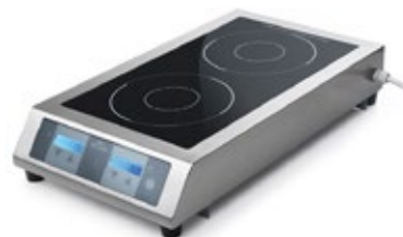
SIRMAN MINNEAPOLIS IH35x2 ΔΙΠΛΗ ΕΠΑΓΩΓΙΚΗ ΕΣΤΙΑ ΕΠΙΦΑΝΕΙΑ ΨΗΣΙΜΑΤΟΣ 308x558 mm