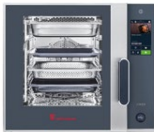
ELOMA JOKER 6-11 ΗΛΕΚΤΡΙΚΟΣ ΦΟΥΡΝΟΣ ΧΩΡΗΤΙΚΟΤΗΤΑ ΤΑΨΙΩΝ 6 X GN1/1