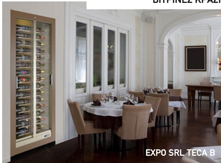
EXPO SRL TECA B