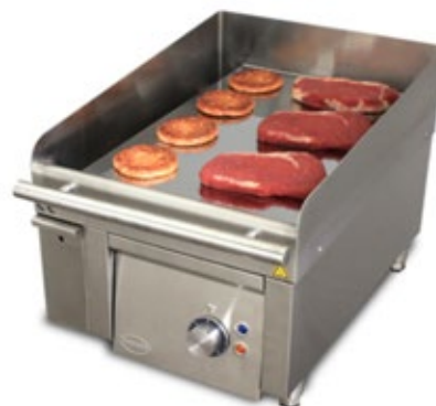
MIRROR M4E ΠΛΑΤΟ ΓΙΑ ΛΟΥΚΑΝΙΚΑ ΔΙΑΣΤΑΣΗ ΠΛΑΚΑΣ mm 350X500