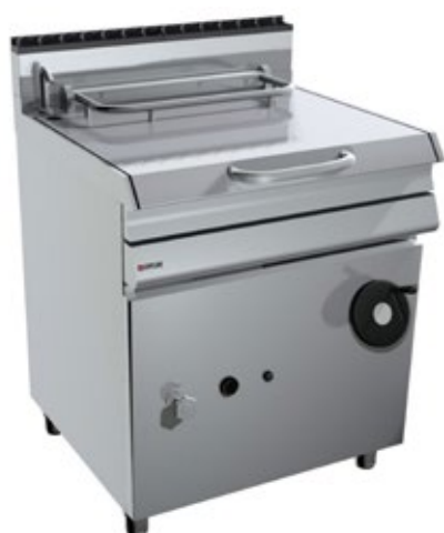
OFFCAR STILE 700 ΗΛΕΚΤΡΙΚΟ ΧΩΡΗΤΙΚΟΤΗΤΑ ΔΟΧΕΙΟΥ 55 lt