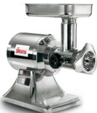
SIRMAN GF 12