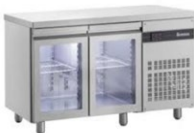
PNR99/GL ΠΑΓΚΟΣ ΣΥΝΤΗΡΗΣΗΣ ΜΕ ΓΥΑΛΙΝΕΣ ΠΟΡΤΕΣ