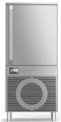
FRIULINOX BOOSTER R RF120AB ΤΑΧΕΙΑΣ ΨΥΞΗΣ 36 kg ΒΑΘΥΑΣ ΤΑΧΕΙΑΣ ΨΥΞΗΣ 24 kg