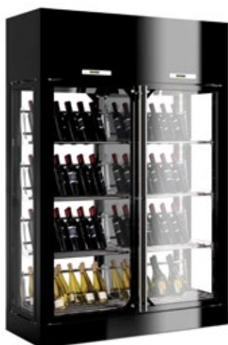
ENOFRIGO WINE 2P 4V ΜΠΟΥΚΑΛΙΑ ΕΩΣ 336