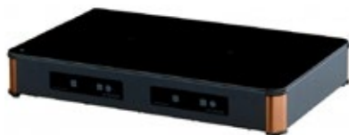
ADVENTYS INDUC -ELEGANCE IE2 ΕΠΑΓΩΓΙΚΗ ΕΣΤΙΑ ΕΠΙΦΑΝΕΙΑ ΨΗΣΙΜΑΤΟΣ 620 x 390 mm