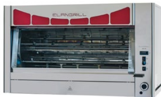
ELANGRILL DELTA 84P ΑΕΡΙΟΥ Χωρητικότητα μέχρι 84 τεμάχια του 1 κιλού