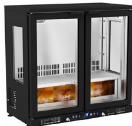
FRENOX DR250G ΩΡΙΜΑΝΤΗΡΙΟ ΚΡΕΑΤΩΝ ΜΕ ΑΛΑΤΙ ΙΜΑΛΑΪΩΝ ΧΩΡΗΤΙΚΟΤΗΤΑ 198 lt