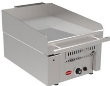
MIRROR Z1 ΠΛΑΤΟ ΑΕΡΙΟΥ ΔΙΑΣΤΑΣΕΙΣ ΠΛΑΚΑΣ mm 350X500