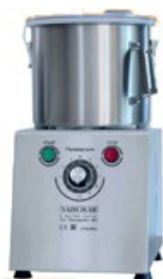
INVERTER YAZICILAR DIV ΧΩΡΗΤΙΚΟΤΗΤΑ 6-9-11 lt