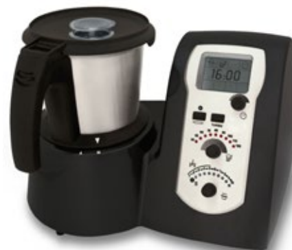
MYCOOK ΘΕΡΜΟΜΠΛΕΝΤΕΡ ΧΩΡΗΤΙΚΟΤΗΤΑ ΔΟΧΕΙΟΥ 2 lt