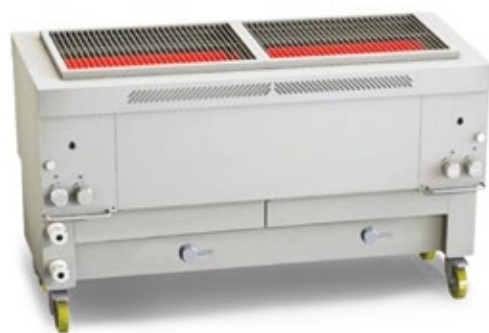
GRESILVA GHPI F5/1450 ΑΕΡΙΟΥ ΔΙΠΛΗ ΨΗΣΤΑΡΙΑ