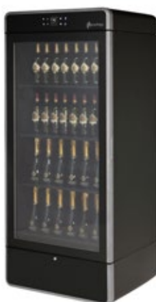
ENOFRIGO H2000 ΜΠΟΥΚΑΛΙΑ 144 - 260