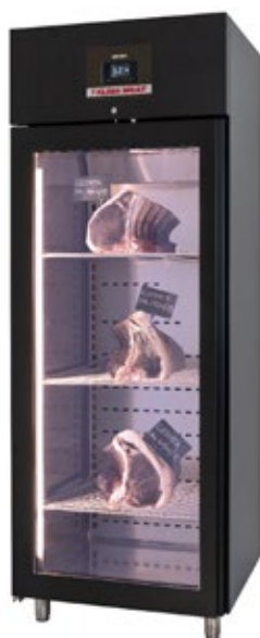
ZERNIKE KMB700PVB ΩΡΙΜΑΝΤΗΡΙΟ ΚΡΕΑΤΩΝ ΧΩΡΗΤΙΚΟΤΗΤΑ 50-130 lt