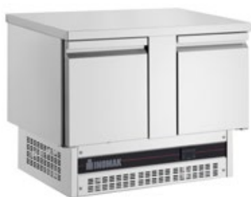
INOMAK BPV7300 ΠΑΓΚΟΣ ΣΥΝΤΗΡΗΣΗΣ ΜΕ ΨΥΚΤΙΚΟ ΜΗΧΑΝΗΜΑ