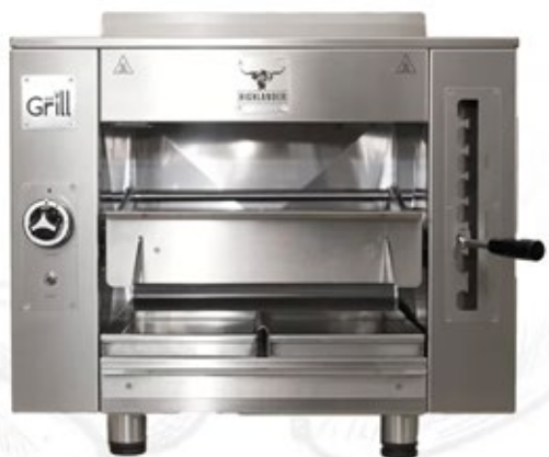
BROILER WEGRILL HIGHLANDER ΑΕΡΙΟΥ ΔΙΑΣΤΑΣΕΙΣ ΣΧΑΡΑΣ 387X374 mm