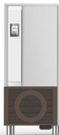
FRIULINOX HICHEF HC17 ΤΑΧΕΙΑΣ ΨΥΞΗΣ 36 kg ΒΑΘΥΑΣ ΤΑΧΕΙΑΣ ΨΥΞΗΣ 24 kg