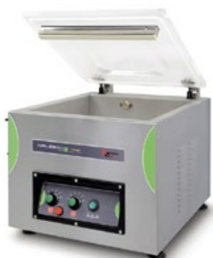
LA MINERVA SLAM 410 ΑΝΑΛΟΓΙΚΟ ΜΗΚΟΣ ΚΟΛΛΗΣΗΣ 27-31-35-41-46-52 εκ.