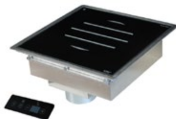
ADVENTYS GL3000 DIR ΕΝΤΟΙΧΙΣΜΕΝΗ ΕΠΑΓΩΓΙΚΗ ΕΣΤΙΑ ΕΠΙΦΑΝΕΙΑ ΨΗΣΙΜΑΤΟΣ 340x340 mm