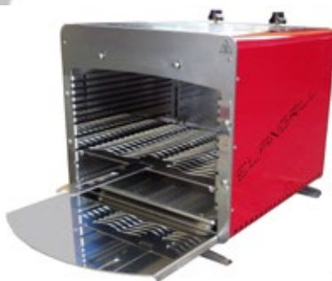
ELANGRILL BULL C ΗΛΕΚΤΡΙΚΗ ΑΝΤΙΣΤΑΣΕΙΣ 1, 2, 3