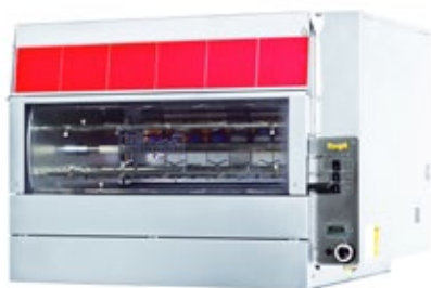
ELANGRILL BETA 42P ΑΕΡΙΟΥ Χωρητικότητα 42 τεμάχια του 1 κιλού