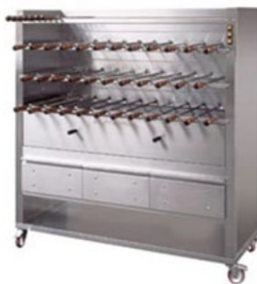
ELANGRILL CM35C ΚΑΡΒΟΥΝΟΥ 35 Ξίφη από ανοξείδωτο χάλυβα 50 cm