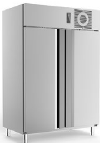
FRIULINOX CUBE AF140 ΘΑΛΑΜΟΣ ΚΑΤΑΨΥΞΗΣ ΧΩΡΗΤΙΚΟΤΗΤΑ 1085 lt