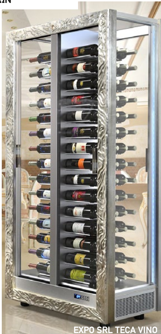
EXPO SRL TECA VINO