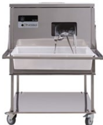
FRUCOSOL SH7000 Παραγωγή 7000-8000 μαχαιροπίρουνα / ώρα