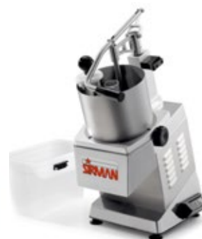
SIRMAN TM TG ΚΟΠΤΗΣ ΛΑΧΑΝΙΚΩΝ - ΤΥΡΙΩΝ