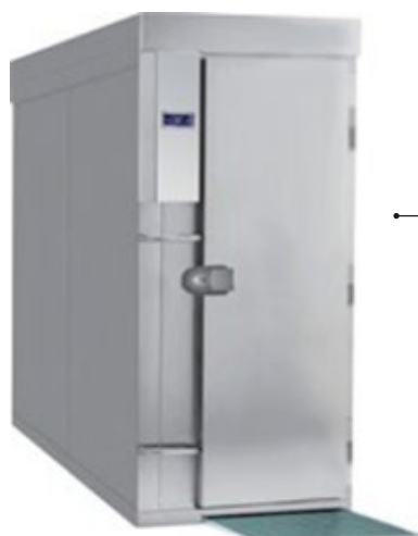
FRIULINOX PLUS BF401 ΤΑΧΕΙΑΣ ΨΥΞΗΣ 140, 210 kg ΒΑΘΥΑΣ ΤΑΧΕΙΑΣ ΨΥΞΗΣ 96, 140 kg