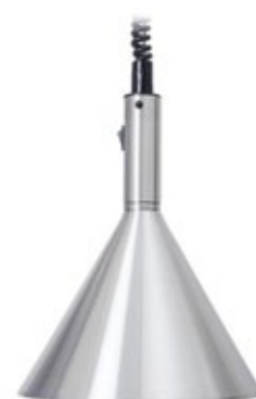
STAYHOT TRATTORIA ALUM