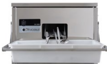
FRUCOSOL SH3000 Παραγωγή 3000-3500 μαχαιροπίρουνα / ώρα