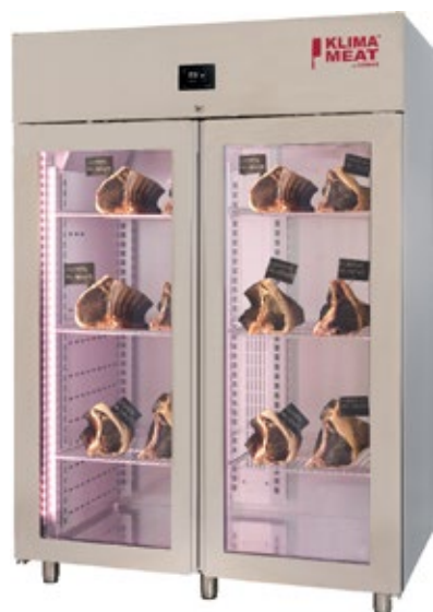
ZERNIKE KMB1500PV ΩΡΙΜΑΝΤΗΡΙΟ ΚΡΕΑΤΩΝ ΧΩΡΗΤΙΚΟΤΗΤΑ 100-280 lt