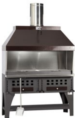
PEVA BL 160 ΚΑΡΒΟΥΝΟΥ ΔΙΑΣΤΑΣΗ ΣΧΑΡΑΣ 3 X 51X42 cm + ΜΑΓΚΑΛΙ ΚΑΡΒΟΥΝΟΥ 47 cm