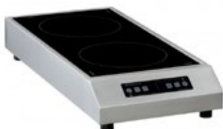
ADVENTYS GLN2 F ΕΠΑΓΩΓΙΚΗ ΕΣΤΙΑ ΕΠΙΦΑΝΕΙΑ ΨΗΣΙΜΑΤΟΣ 280x560 mm