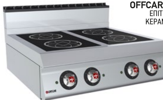
OFFCAR STILE 700 70TCE4V ΕΠΙΤΡΑΠΕΖΙΑ ΗΛΕΚΤΡΙΚΗ ΚΕΡΑΜΙΚΗ ΕΣΤΙΑ ΤΕΤΡΑΠΛΗ