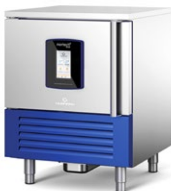
NORMANN NORTECH PLUS 5 ΤΑΧΕΙΑΣ ΨΥΞΗΣ 23 kg ΒΑΘΥΑΣ ΤΑΧΕΙΑΣ ΨΥΞΗΣ 16 kg