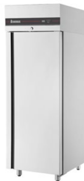
SLIM INOMAK CAS172/SL ΘΑΛΑΜΟΣ ΣΥΝΤΗΡΗΣΗΣ