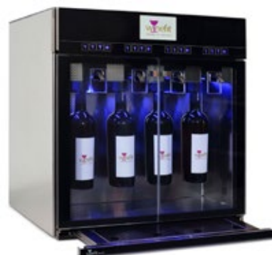
WINEFIT EVO ΓΙΑ 4 ΜΠΟΥΚΑΛΙΑ ΜΕ 2 ΖΩΝΕΣ ΨΥΞΗΣ • ΜΕ 2 ΜΠΟΥΚΑΛΕΣ ΑΡΓΟ