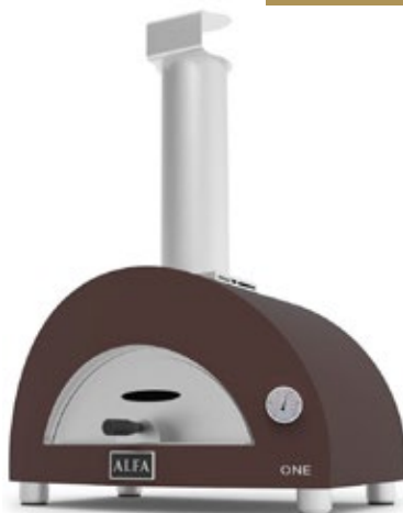
ALFA PIZZA ONE ΦΟΥΡΝΟΣ ΠΙΤΣΑΣ ΞΥΛΟΥ ΧΩΡΗΤΙΚΟΤΗΤΑ ΠΙΤΣΕΣ 1 (40 cm)