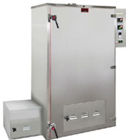
ΒΕΕΛΟΝΙΑ F4 ΞΗΡΑΝΤΗΡΙΟ ΚΑΙ ΚΑΠΝΙΣΤΗΡΙΟ ΛΟΥΚΑΝΙΚΩΝ