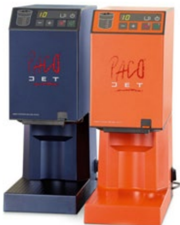
PACOJET JUNIOR ΧΩΡΗΤΙΚΟΤΗΤΑ ΔΟΧΕΙΟΥ 0,8 lt