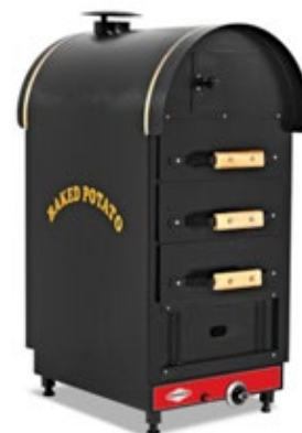
EMPERO KFE ΦΟΥΡΝΟΣ ΠΑΤΑΤΑΣ / ΡΕΥΜΑ - ΑΕΡΙΟ ΤΕΜΑΧΙΑ/ΩΡΑ 24-30