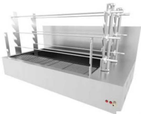
ΕΠΙΤΡΑΠΕΖΙΑ ΨΗΣΤΑΡΙΑ ΚΑΡΒΟΥΝΟΥ ΣΟΥΒΛΕΣ 3, 6, 9