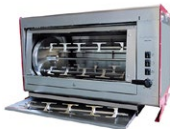
ELANGRILL Planetari Elba 16P ΗΛΕΚΤΡΙΚΗ Χωρητικότητα μέχρι 16 τεμάχια του 1 κιλού