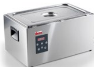
GN 2/3 - GN 1/1

Διάσταση (Π x Β x Υ) 165x203x377 Ισχύς kw 2 Θερμοκρασία 24 - 99