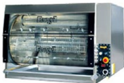
ELANGRILL DOUBLE GLAZED 42 ΑΕΡΙΟΥ Χωρητικότητα 42 τεμάχια του 1 κιλού