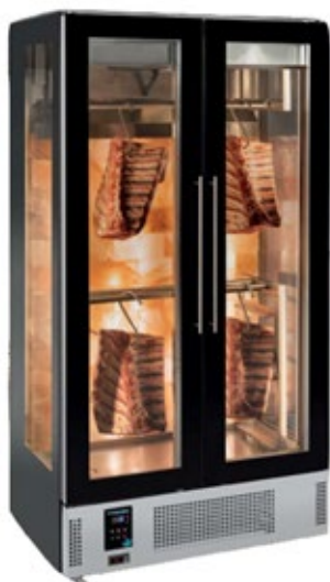
FRENOX DR10GHM ΩΡΙΜΑΝΤΗΡΙΟ ΚΡΕΑΤΩΝ 3 ΠΛΕΥΡΕΣ ΓΥΑΛΙ ΜΕ ΑΛΑΤΙ ΙΜΑΛΑΪΩΝ ΧΩΡΗΤΙΚΟΤΗΤΑ 1300 lt