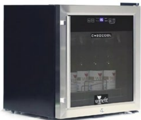
WINEFIT CUBO ΓΙΑ 10 ΜΠΟΥΚΑΛΙΑ