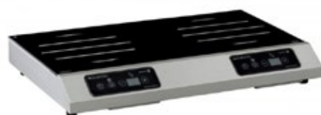
ADVENTYS GL2 S ΕΠΑΓΩΓΙΚΗ ΕΣΤΙΑ ΕΠΙΦΑΝΕΙΑ ΨΗΣΙΜΑΤΟΣ 650x323 mm