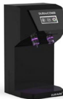
WINEFIT DURAVIN+ DURACOMBI Διάσταση (Π x Β x Υ) 260x290x520 mm