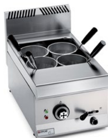
OFFCAR UNICO 650 ΧΩΡΗΤΙΚΟΤΗΤΑ ΔΟΧΕΙΟΥ 12 lt