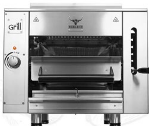
BROILER WEGRILL HIGHLANDER ΗΛΕΚΤΡΙΚΗ ΔΙΑΣΤΑΣΕΙΣ ΣΧΑΡΑΣ 387X374 mm