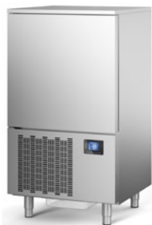
NORMANN ENTRY 7 ΤΑΧΕΙΑΣ ΨΥΞΗΣ 25 kg ΒΑΘΥΑΣ ΤΑΧΕΙΑΣ ΨΥΞΗΣ 15 kg