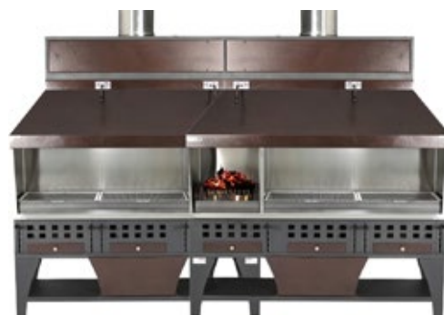
PEVA BL 250 ΚΑΡΒΟΥΝΟΥ ΔΙΑΣΤΑΣΗ ΣΧΑΡΑΣ 4 X 50X42 cm + ΜΑΓΚΑΛΙ ΚΑΡΒΟΥΝΟΥ 33 cm