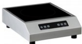
ADVENTYS GLN ΕΠΑΓΩΓΙΚΗ ΕΣΤΙΑ ΕΠΙΦΑΝΕΙΑ ΨΗΣΙΜΑΤΟΣ 280x280 mm