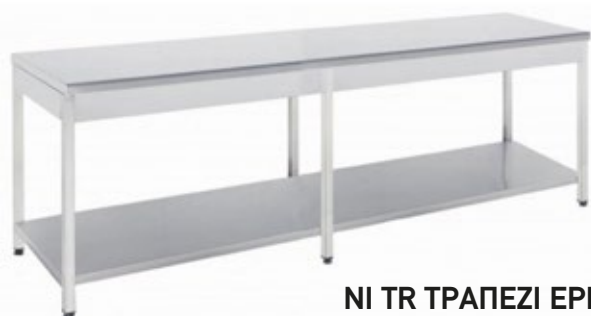
NI TR ΤΡΑΠΕΖΙΑ ΕΡΓΑΣΙΑΣ ΣΕ ΠΟΛΛΑ ΜΕΓΕΘΗ