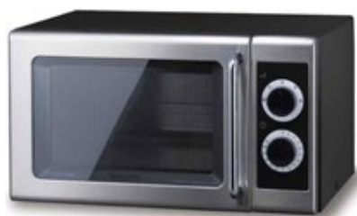
MINNEAPOLIS CM ΧΩΡΗΤΙΚΟΤΗΤΑ 26 lt