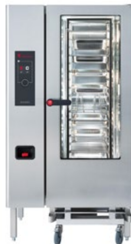
ELOMA MULTIMAX 20-11 ΗΛΕΚΤΡΙΚΟΣ ΦΟΥΡΝΟΣ ΧΩΡΗΤΙΚΟΤΗΤΑ ΤΑΨΙΩΝ 20 X GN1/1