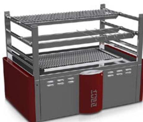
ΚΟΡΑ ROBATA R90T R120T ΚΑΡΒΟΥΝΟΥ ΨΗΣΤΑΡΙΑ ΠΟΛΛΑΠΛΩΝ ΕΠΙΠΕΔΩΝ ΣΟΥΒΛΕΣ 3, 6, 9