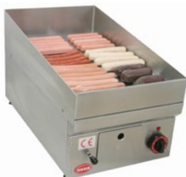
MIRROR M 350 E ΠΛΑΤΟ ΓΙΑ ΛΟΥΚΑΝΙΚΑ ΔΙΑΣΤΑΣΗ ΠΛΑΚΑΣ mm 350X565