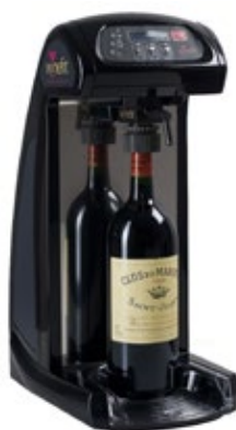
WINEFIT ONE Διάσταση (Π x Β x Υ) 255x386x565 mm