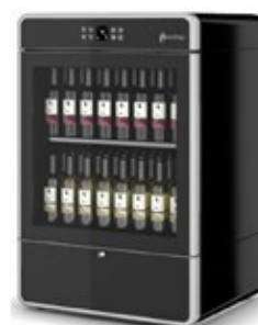
ENOFRIGO H1200 ΜΠΟΥΚΑΛΙΑ 130