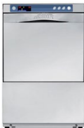
DIHR GS 35 T Καλάθι mm 350x350