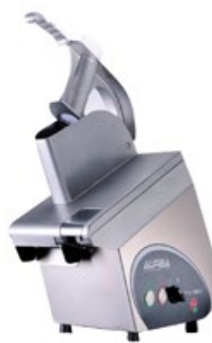
AUREA TV TV80 - TV100 - TV150 ΚΟΠΤΕΣ ΛΑΧΑΝΙΚΩΝ - ΤΥΡΙΩΝ