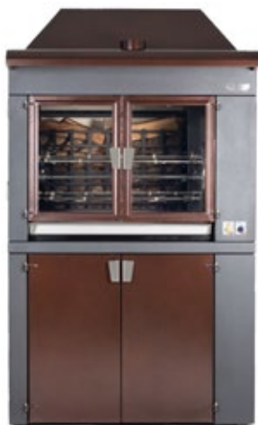
PEVA GA ΣΟΥΒΛΑ ΞΥΛΟΥ Χωρητικότητα κοτόπουλου 16, 24, 20, 30