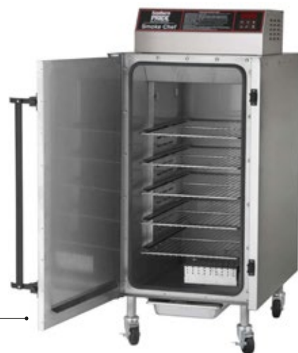
SOUTHERN PRIDE SC-300 ΦΟΥΡΝΟΣ ΚΑΠΝΙΣΜΑΤΟΣ