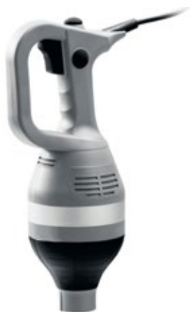
SIRMAN VORTEX 35-45 cm ΜΠΑΡΑ