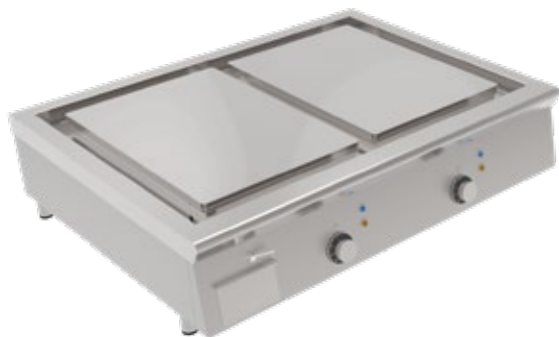
MIRROR PLF 2 ΔΙΑΣΤΑΣΕΙΣ ΠΛΑΚΑΣ mm 2X(355X515) ΖΩΝΕΣ ΨΗΣΙΜΑΤΟΣ 2