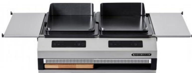
ADVENTYS OCTOPUS PACK 2 ΔΙΑΣΤΑΣΕΙΣ ΠΛΑΚΑΣ mm 2X(280x560) ΖΩΝΕΣ ΨΗΣΙΜΑΤΟΣ 2