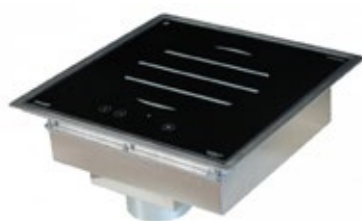
ADVENTYS GL3000 DI ΕΝΤΟΙΧΙΣΜΕΝΗ ΕΠΑΓΩΓΙΚΗ ΕΣΤΙΑ ΕΠΙΦΑΝΕΙΑ ΨΗΣΙΜΑΤΟΣ 340x340 mm