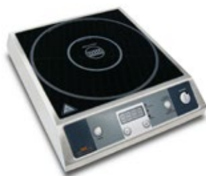
SIRMAN MINEAPOLIS IH ΕΠΑΓΩΓΙΚΗ ΕΣΤΙΑ ΕΠΙΦΑΝΕΙΑ ΨΗΣΙΜΑΤΟΣ 280x280 mm