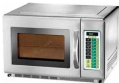
EASY LINE MC/1800 ΧΩΡΗΤΙΚΟΤΗΤΑ 35 lt