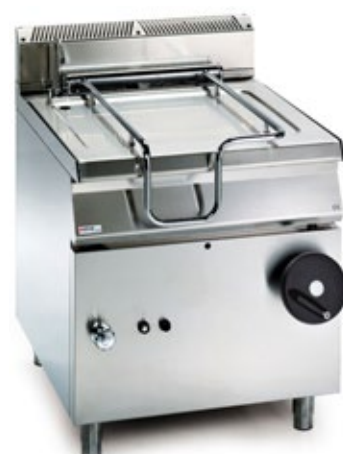
OFFCAR STILE 980 80BRG80I ΑΕΡΙΟΥ ΧΩΡΗΤΙΚΟΤΗΤΑ ΔΟΧΕΙΟΥ 82 lt