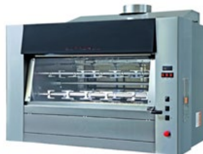
ELANGRILL LEGNA 30P ΣΟΥΒΛΑ ΞΥΛΟΥ / ΠΛΑΝΗΤΙΚΗ Πλανητικοί δίσκοι, 6 σούβλες των 910mm απο ανοξείδωτο χάλυβα