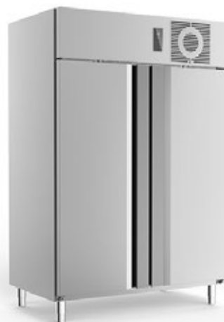
FRIULINOX CUBE AR140 ΘΑΛΑΜΟΣ ΣΥΝΤΗΡΗΣΗΣ ΧΩΡΗΤΙΚΟΤΗΤΑ 1085 lt