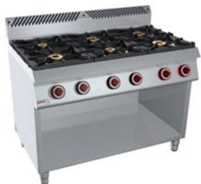
OFFCAR STILE 700 70CBG06 ΑΕΡΙΟΥ ΜΕ ΕΡΜΑΡΙΟ ΜΕ ΒΑΘΟΣ 73 cm