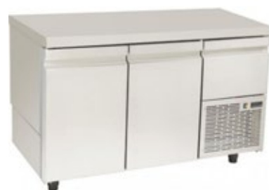
KONTEX PAGNKF ΠΑΓΚΟΣ ΚΑΤΑΨΥΞΗΣ ΜΕ ΨΥΚΤΙΚΟ ΜΗΧΑΝΗΜΑ