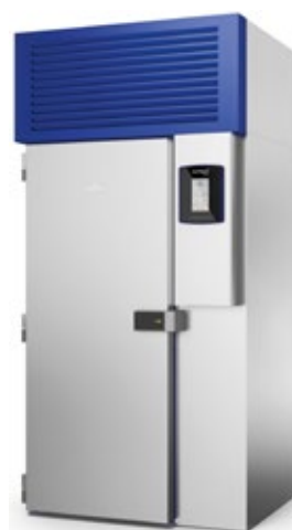
NORMANN NORTECH PLUS 20 ΤΑΧΕΙΑΣ ΨΥΞΗΣ 108 kg ΒΑΘΥΑΣ ΤΑΧΕΙΑΣ ΨΥΞΗΣ 85 kg