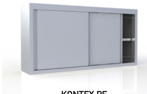
KONTEX PE ΠΟΤΗΡΙΑΡΑ ΜΕ ΣΥΡΟΜΕΝΕΣ ΠΟΡΤΕΣ