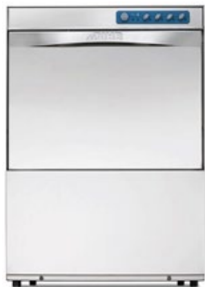
DIHR DS 35 - 40 - 50 ΔΙΠΛΟ ΤΟΙΧΩΜΑ