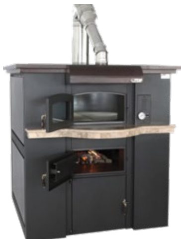
ΡΕΒΑ Κ60/1 ΦΟΥΡΝΟΣ ΞΥΛΟΥ ΔΙΑΜΕΤΡΟΣ ΦΟΥΡΝΟΥ mm 1100