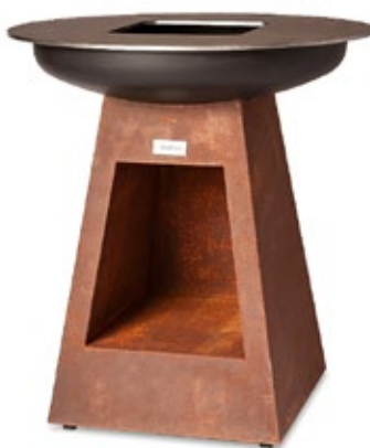
ONFIRE BBQ ύψος 100 cm με αποθήκη ξύλου