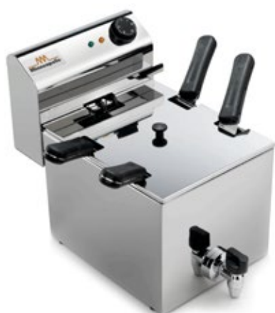
SIRMAN PASTI ΧΩΡΗΤΙΚΟΤΗΤΑ ΔΟΧΕΙΟΥ 6 & 8 lt