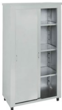
NI ERSK ΕΡΜΑΡΙΟ ΣΚΕΥΩΝ ΣΕ ΠΟΛΛΑ ΜΕΓΕΘΗ