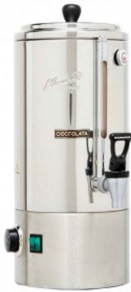
CAMURRI CC.5 Χωρητικότητα 5 λίτρα