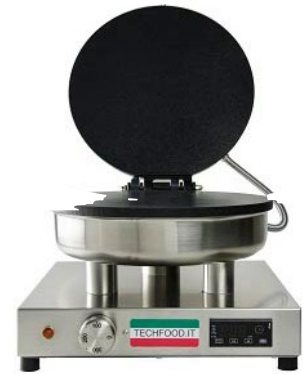
CREPES GOURMET ΚΡΕΠΙΕΡΑ