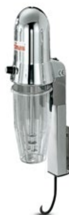
SIRMAN SIRIO PARETE ΕΠΙΤΟΙΧΙΑ