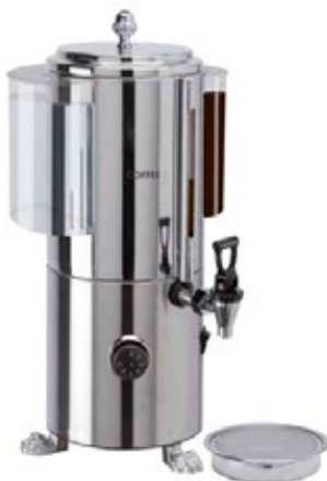
CAMURRI TC.3 Παραγωγή 3 λίτρα