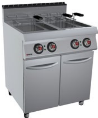
OFFCAR STILE 700 70FRE-34 ΕΠΙΔΑΠΕΔΙΑ ΗΛΕΚΤΡΙΚΗ ΦΡΙΤΕΖΑ ΜΕ ΔΥΟ ΔΕΞΑΜΕΝΕΣ 17+17 lt