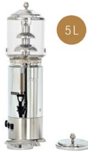
CAMURRI CC.F.5 Χωρητικότητα 5 λίτρα