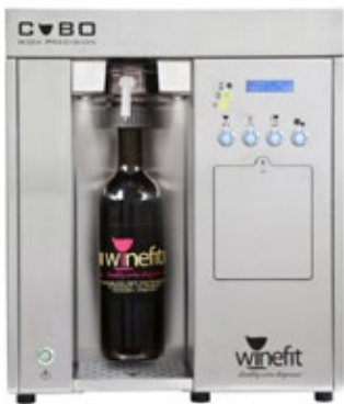
WINEFIT CUBO ΔΙΑΝΕΜΗΤΗΣ ΚΡΑΣΙΟΥ