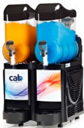
Faby Skyline Express Δοχείο 10 lt