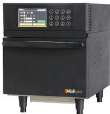
ATOLLSPEED AS300H ΥΨΗΛΗΣ ΤΑΧΗΤΗΤΑΣ ΦΟΥΡΝΟΣ