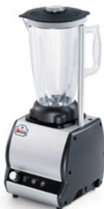
SIRMAN ORIONE T ΧΩΡΗΤΙΚΟΤΗΤΑ ΔΟΧΕΙΟΥ 2lt