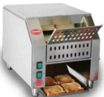
MIRROR TR ΜΗΧΑΝΗ ΦΡΥΓΑΝΙΑΣ