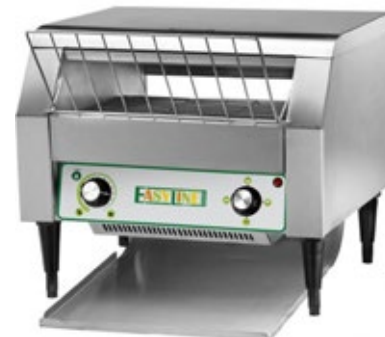
EASYLINE EST-A-3 ΦΡΥΓΑΝΙΕΡΑ