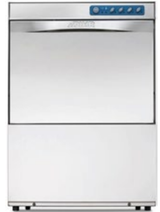
DIHR GS 50 ΠΛΥΝΤΗΡΙΟ ΠΙΑΤΩΝ - ΠΟΤΗΡΙΩΝ