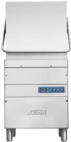
DIHR HT 11 ECO ΠΛΥΝΤΗΡΙΟ ΠΙΑΤΩΝ - ΠΟΤΗΡΙΩΝ