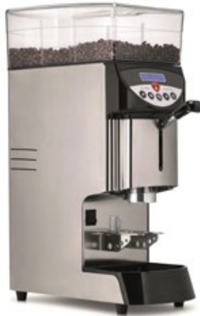
EUREKA MYTHOS ΧΩΡΗΤΙΚΟΤΗΤΑ ΔΟΧΕΙΟΥ 3,2 Kgr