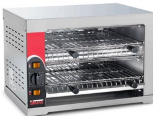
EASYLINE EG-03 ΜΕΓΕΘΟΣ ΨΗΣΙΜΑΤΟΣ 450X330 X2