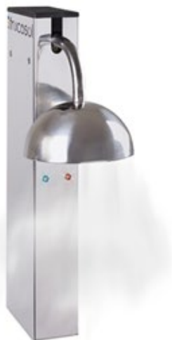
FRUCOSOL GF1000 ΨΥΚΤΗΣ ΠΟΤΗΡΙΩΝ