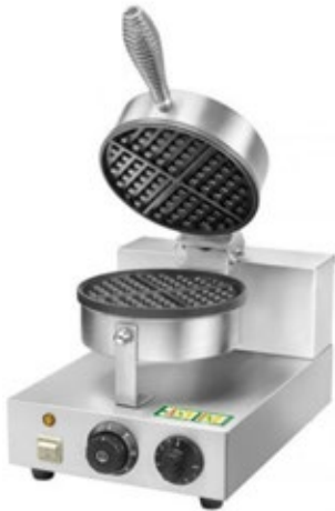
EASYLENE WM1 ΒΑΦΛΙΕΡΑ