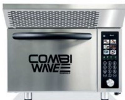
COMBI WAVE ΥΨΗΛΗΣ ΤΑΧΗΤΗΤΑΣ ΦΟΥΡΝΟΣ