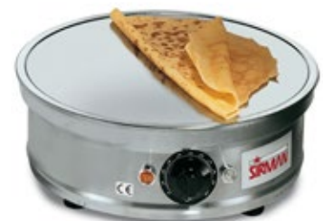
SIRMAN TONDA ΕΠΑΓΓΕΛΜΑΤΙΚΗ ΚΡΕΠΙΕΡΑ