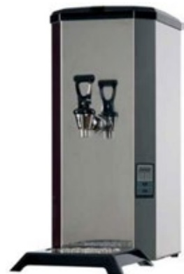
COFFEE QUEEN HVA Χωρητικότητα 7,5 λίτρα