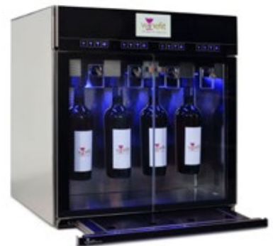
WINEFIT EVO ΨΥΧΟΜΕΝΟΣ ΔΙΑΝΕΜΗΤΗΣ ΚΡΑΣΙΩΝ