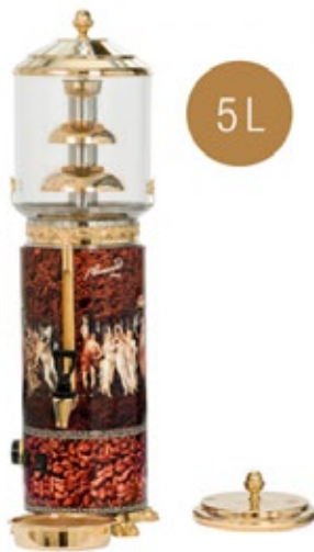
CAMURRI CC.F.SP.5 Χωρητικότητα 5 λίτρα