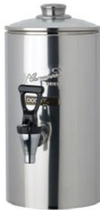
CAMURRI CC.B.1 Χωρητικότητα 1 λίτρο