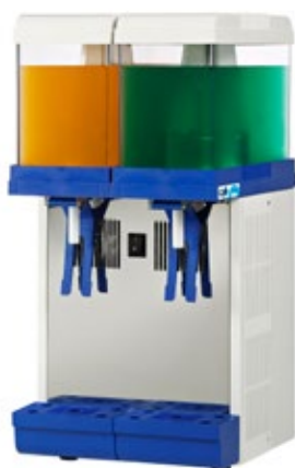
Luke Δοχείο 6 lt