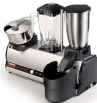
ΤΡΙΠΛΟ SIRMAN MODULO 3 ΠΟΛΥΜΗΧΑΝΗΜΑ