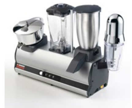
ΤΕΤΡΑΠΛΟ SIRMAN MODULO 4 ΠΟΛΥΜΗΧΑΝΗΜΑ