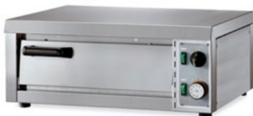
FORNITALIA BABY 1 ΗΛΕΚΤΡΙΚΟΣ ΦΟΥΡΝΟΣ ΠΙΤΣΑΣ