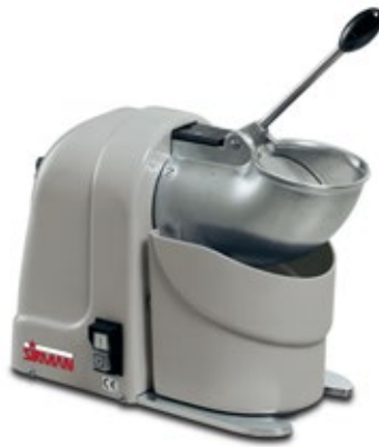
SIRMAN TRITON ΧΩΡΗΤΙΚΟΤΗΤΑ ΔΟΧΕΙΟΥ 2lt