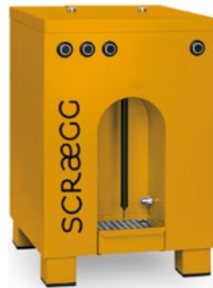
SCRAEGG ΜΗΧΑΝΗΜΑ ΠΑΡΑΣΚΕΥΗΣ ΦΡΕΣΚΙΑΣ ΚΑΙ ΑΦΡΑΤΗΣ ΟΜΕΛΕΤΑΣ