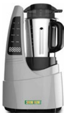
EASYLINE TM-1128 ΘΕΡΜΑΙΝΟΜΕΝΟ ΜΠΛΕΝΤΕΡ