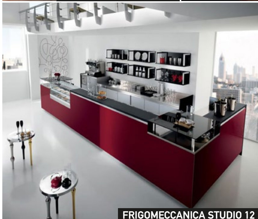
FRIGOMECCANICA STUDIO 12