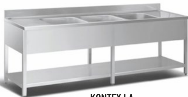
KONTEX LA ΛΑΝΤΖΑ ΤΡΕΙΣ ΓΟΥΡΝΕΣ