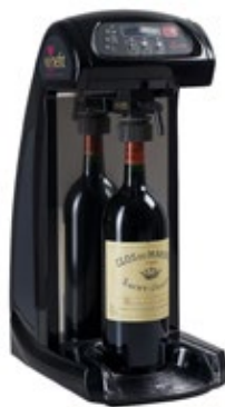
WINEFIT ΔΙΑΝΕΜΗΤΗΣ ΚΡΑΣΙΟΥ