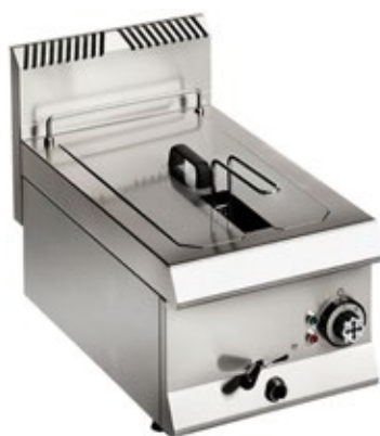
OFFCAR UNICO 650 ΗΛΕΚΤΡΙΚΗ ΕΠΙΤΡΑΠΕΖΙΑ ΦΡΙΤΕΖΑ ΜΟΝΗ