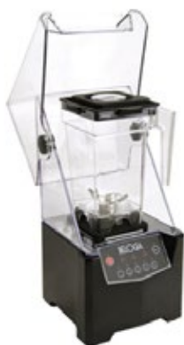
BELOGIA BL-6MC ΧΩΡΗΤΙΚΟΤΗΤΑ ΔΟΧΕΙΟΥ 1,5lt