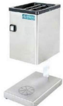
STAFF ICE TG60 ΠΑΡΑΓΩΓΗ ΑΝΑ ΩΡΑ 60 kg