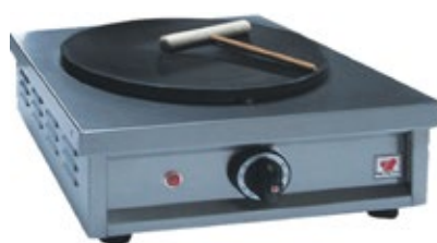
NORTH HF Ηλεκτρική κρεπιέρα Φ 35