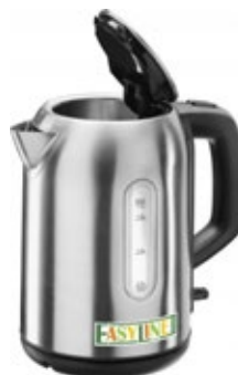
EASYLINE T906 Χωρητικότητα 1,7 λίτρα