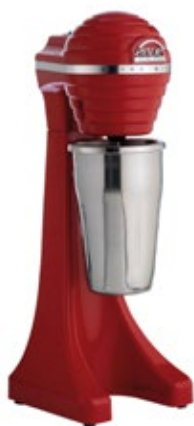
ARTEMIS ECONOMY MIX-2010