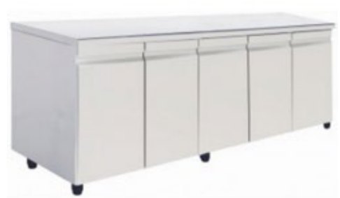
NI ERGN ΕΡΜΑΡΙΟ ΜΕ ΑΝΟΙΓΟΜΕΝΕΣ ΠΟΡΤΕΣ