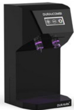
WINEFIT DURAVIN DURACOMBI