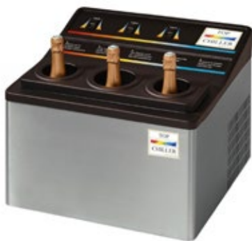
WINEFIT TOP CHILLER ΔΙΑΝΕΜΗΤΗΣ ΚΡΑΣΙΟΥ