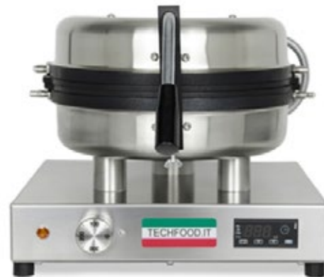
RONDO UNIKA ΠΟΛΥΜΗΧΑΝΗΜΑ ΜΕ ΕΝΑΛΛΑΣΜΟΝΕΣ ΠΛΑΚΕΣ