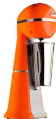
ARTEMIS COLOUR A-2001