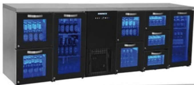
FRENOX MB ΠΑΓΚΟΣ ΣΥΝΤΗΡΗΣΗΣ BAR