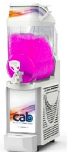
Faby Infinity Δοχείο 12 lt