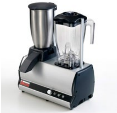
SIRMAN MODULO 2 ΠΑΓΟΘΡΑΥΣΤΗΣ ΜΠΛΕΝΤΕΡ