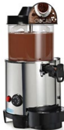
Adatto a Χωρητικότητα 5 λίτρα