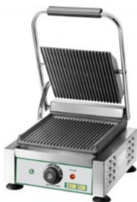
EASYLINE EG-01 ΜΕΓΕΘΟΣ ΨΗΣΙΜΑΤΟΣ 230X240mm