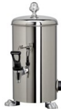
CAMURRI HWB.5 Χωρητικότητα 5 λίτρα