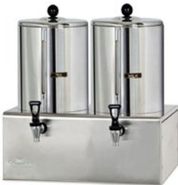
CAMURRI BMD.20 Χωρητικότητα 40 λίτρα