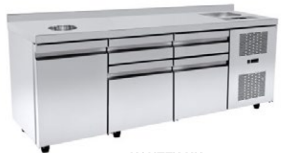
KONTEX KK ΨΥΧΟΜΕΝΟ ΕΡΜΑΡΙΟ ΚΑΦΕ