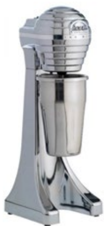
ARTEMIS ΧΡΩΜΙΟΥ MIX-2010