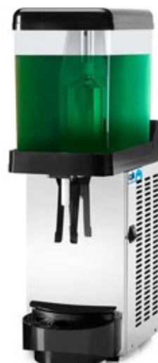
Zippy Δοχείο 12 lt