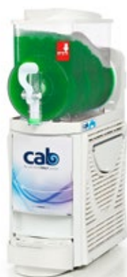
Faby Cream Δοχείο 6 lt