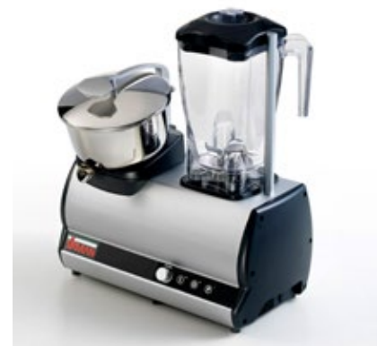
SIRMAN MODULO 2 ΑΠΟΧΥΜΩΤΗΣ ΜΠΛΕΝΤΕΡ