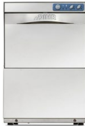
DIHR GS 35 ΠΛΥΝΤΗΡΙΟ ΠΟΤΗΡΙΩΝ