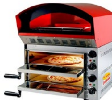
LAPIZZERIA JUNIOR ΗΛΕΚΤΡΙΚΟΣ ΦΟΥΡΝΟΣ ΠΙΤΣΑΣ ΚΑΙ ΑΛΛΩΝ ΠΡΟΙΟΝΤΩΝ