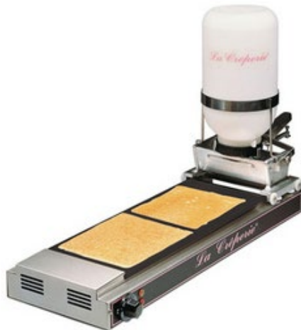
LA CREPERIE ΜΗΧΑΝΗ ΠΑΡΑΓΩΓΗΣ ΚΡΕΠΑΣ