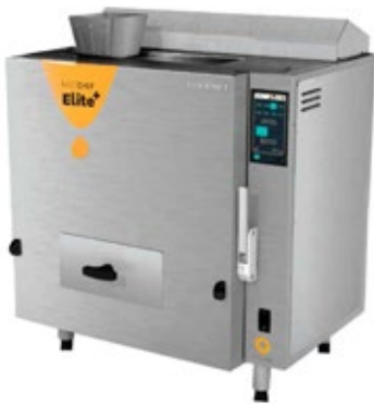
QUALITYFRY FAST CHEF ELITE GOURMET ΑΥΤΟΜΑΤΗ ΗΛΕΚΤΡΙΚΗ ΦΡΙΤΕΖΑ