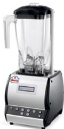
SIRMAN BARMASTER Q ΧΩΡΗΤΙΚΟΤΗΤΑ ΔΟΧΕΙΟΥ 2lt