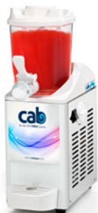
Blaze Δοχείο 2 lt