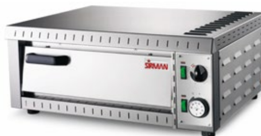
SIRMAN STROMBOLI ΗΛΕΚΤΡΙΚΟΣ ΦΟΥΡΝΟΣ ΠΙΤΣΑΣ