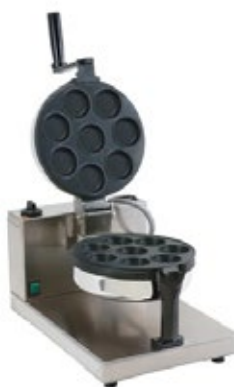
PANCAKE LA CIALDERIA ΜΗΧΑΝΗ ΓΙΑ PANCAKES TECHFOOD