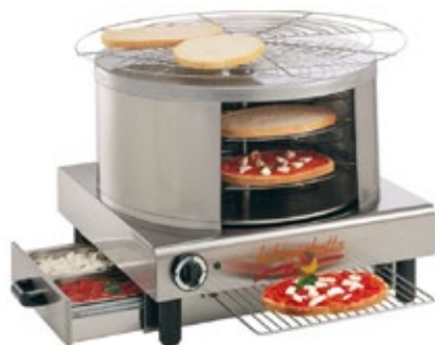
LABRUSCHETTA ΠΕΡΙΣΤΡΟΦΙΚΟΣ ΦΟΥΡΝΟΣ ΓΙΑ ΤΟ ΨΗΣΙΜΟ ΜΠΡΟΥΣΚΕΤΑΣ