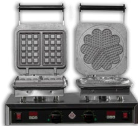
WAF/ID HB ΒΑΦΛΙΕΡΑ