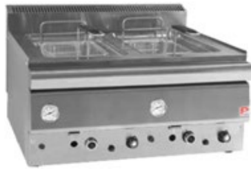
PAN FR ΦΡΙΤΕΖΑ ΑΕΡΙΟΥ