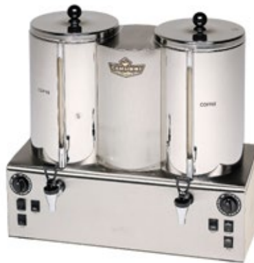
CAMURRI TA.9 Χωρητικότητα 18 λίτρα