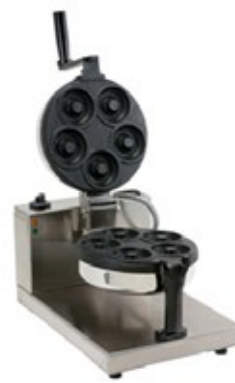
LA CIALDERIA DONUTS ΜΗΧΑΝΗ ΓΙΑ ΤΟ ΨΗΣΙΜΟ DONUTS