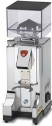
EUREKA MIGNON ΧΩΡΗΤΙΚΟΤΗΤΑ ΔΟΧΕΙΟΥ 0,5 Kgr