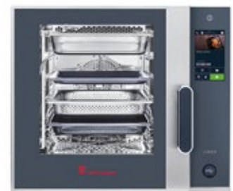
ELOMA JOKER 6-11 ΗΛΕΚΤΡΙΚΟΣ ΦΟΥΡΝΟΣ ΧΩΡΗΤΙΚΟΤΗΤΑ ΤΑΨΙΩΝ 6 Χ 6Ν1/1