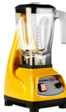
JOHNY AK/12 ECO ΧΩΡΗΤΙΚΟΤΗΤΑ ΔΟΧΕΙΟΥ 2,5lt