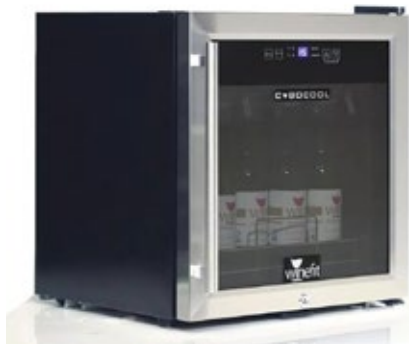
WINEFIT CUBOCOOL ΨΥΧΟΜΕΝΟΣ ΔΙΑΝΕΜΗΤΗΣ ΚΡΑΣΙΩΝ