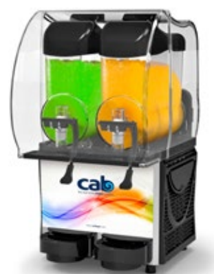
Faby Igloo Δοχείο 10 lt