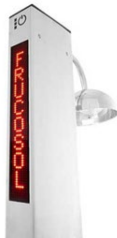
FRUCOSOL GF1000 ΨΥΚΤΗΣ ΠΟΤΗΡΙΩΝ ΜΕ ΟΘΟΝΗ