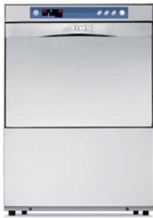
DIHR DS 35 T ΠΛΥΝΤΗΡΙΟ ΠΟΤΗΡΙΩΝ ΔΙΠΛΟΥ ΤΟΙΧΩΜΑΤΟΣ