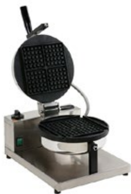
WAFFLE STICK LA CIALDERIA ΜΗΧΑΝΗ WAFFLE STICK