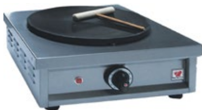
NORTH GAS Επιτραπέζια κρεπιέρα υγραερίου Φ 35 με σπινθηριστή