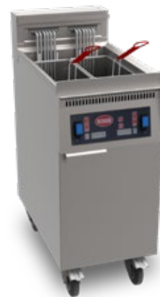
MIRROR F7C - CL ΗΛΕΚΤΡΙΚΗ ΑΥΤΟΜΑΤΗ ΦΡΙΤΕΖΑ