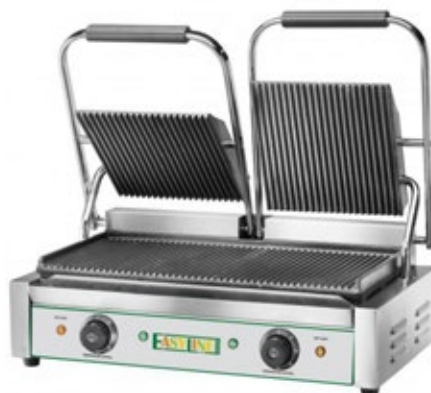
EASYLINE EG-03 ΜΕΓΕΘΟΣ ΨΗΣΙΜΑΤΟΣ 475X230mm