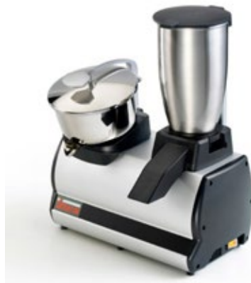
SIRMAN MODULO 2 ΑΠΟΧΥΜΩΤΗΣ ΠΑΓΟΘΡΑΥΣΤΗΣ