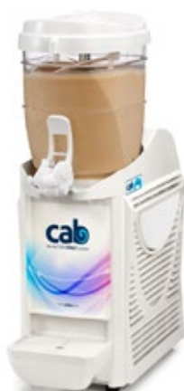
Caress Δοχείο 5,5 lt