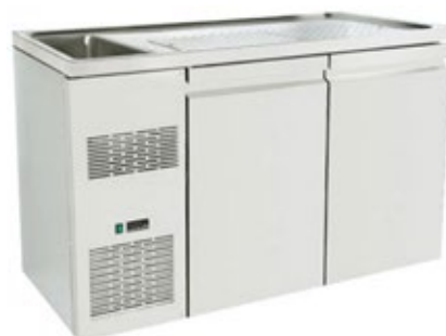
KONTEX PAGE160L1 ΠΑΓΚΟΣ ΨΥΓΕΙΟ ΜΠΥΡΑΣ