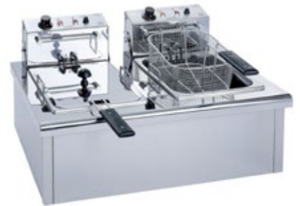
F70 ΗΛΕΚΤΡΙΚΗ ΦΡΙΤΕΖΑ