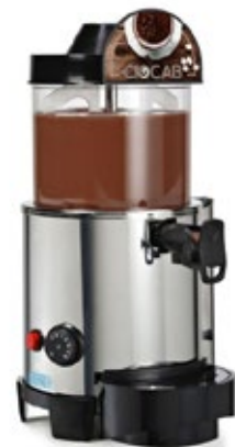
Ciocab Χωρητικότητα 5 λίτρα