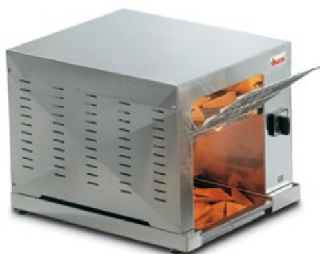
SIRMAN BREAKFAST ΜΗΧΑΝΗ ΦΡΥΓΑΝΙΑΣ ΩΡΙΑΙΑ ΠΑΡΑΓΩΓΗ ΤΕΜΑΧΙΑ 200