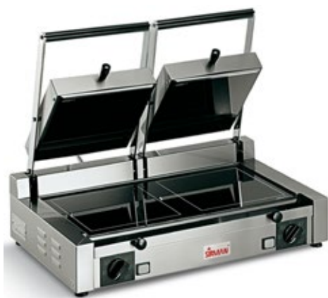
SIRMAN CORT V ΔΙΠΛΗ ΚΕΡΑΜΙΚΗ ΤΟΣΤΙΕΡΑ 260x290 x2 (mm)