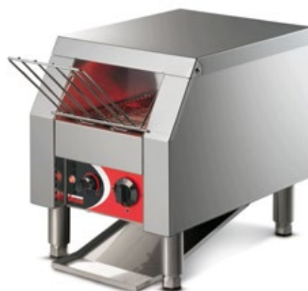
SIRMAN ROLLER TOSTI ΜΗΧΑΝΗ ΦΡΥΓΑΝΙΑΣ ΩΡΙΑΙΑ ΠΑΡΑΓΩΓΗ ΤΕΜΑΧΙΑ MIN 65 - MAX 360