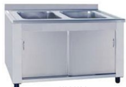
NI LK2G ΛΑΝΤΖΑ ΚΛΕΙΣΤΗ ΔΥΟ ΓΟΥΡΝΕΣ