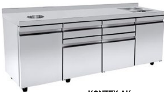
KONTEX AK ΕΡΜΑΡΙΟ ΚΑΦΕ