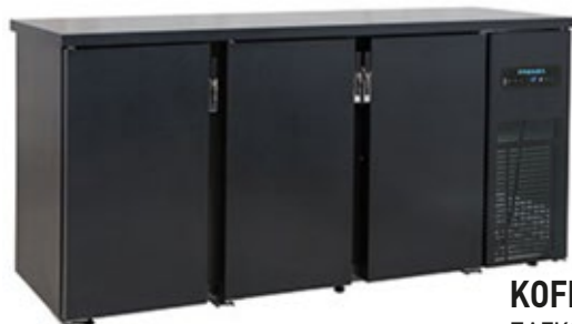
KOFRENOX SSN ΠΑΓΚΟΣ ΣΥΝΤΗΡΗΣΗΣ ΑΝΑΨΥΚΤΙΚΩΝ