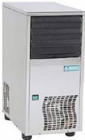
STAFF ICE MP ΠΑΓΟΜΗΧΑΝΗ ΜΕ ΤΡΥΠΑ ΣΤΟ ΠΑΓΑΚΙ