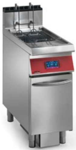
OFFCAR SUPERFRY 2.0 ΑΥΤΟΜΑΤΗ ΗΛΕΚΤΡΙΚΗ / ΑΕΡΙΟΥ ΦΡΙΤΕΖΑ