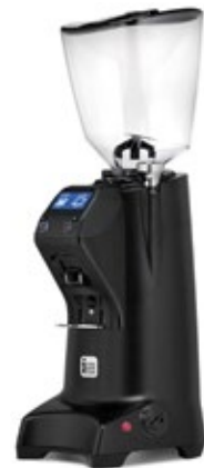
EUREKA OLYMPUS 75 E HS ΧΩΡΗΤΙΚΟΤΗΤΑ ΔΟΧΕΙΟΥ 1,6 Kgr