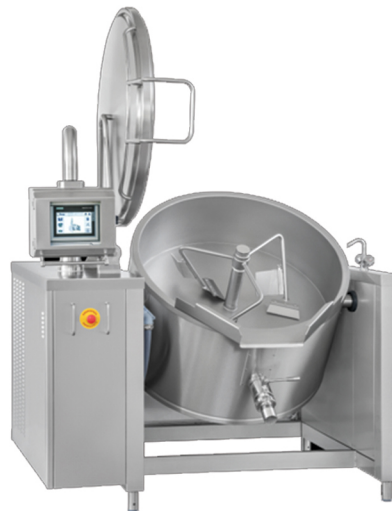
NILMA SALSAMAT PEYMA-AERIO-ATMOS ME ANATROPHE-ME ANAMEIHE 80-160-300-500 It