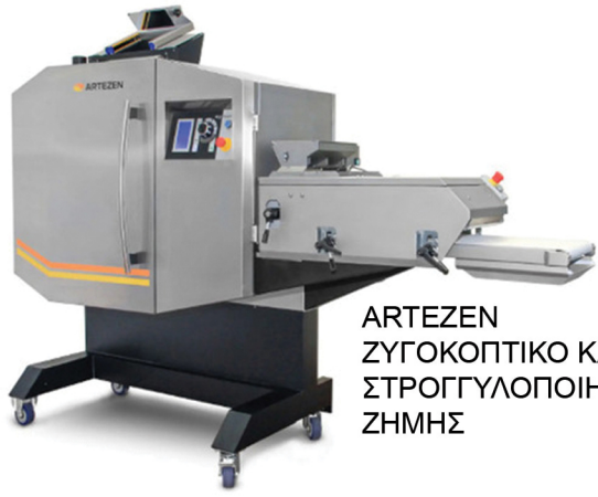
ARTEZEN ΖΥΓΟΚΟΠΤΙΚΟ ΚΑΙ ΣΤΡΟΓΓΥΛΟΠΟΙΗΤΗΣ ΖΗΜΗΣ