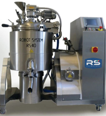
RS TECNOLOGIE ΘΕΡΜΙΚΗ ΕΠΕΞΕΡΓΑΣΙΑ ΤΡΟΦΙΜΩΝ (ΜΑΡΜΕΛΑΔΕΣ, ΠΟΛΤΟΠΟΙΗΣΗ)