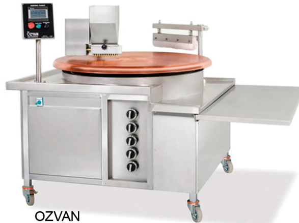
OZVAN ΜΗΧΑΝΗΜΑ ΠΑΡΑΓΩΓΗΣ ΚΑΝΤΑΪΦΙ