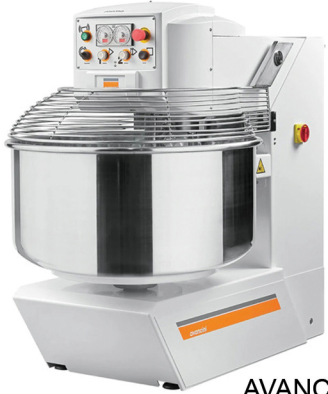
AVANCINI MOMA ΖΥΜΩΤΗΡΙΟ 60,80,100,130,160 ΚΙΛΑ