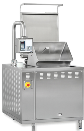
NILMA DOUGHOMAT ΡΕΥΜΑ - ΑΕΡΙΟ ΧΩΡΗΤΙΚΟΤΗΤΑ ΚΙΛΑ: 7 - 20 - 40 - 60