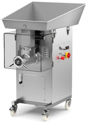
LA MINERVA ΚΡΕΑΤΟΜΗΧΑΝΗ ΨΥΧΟΜΕΝΗ ΠΑΡΑΓΩΓΗ 1500 ΚΙΛΑ ΑΝΑ ΩΡΑ ΙΣΧΥΣ 7 ΙΠΠΟΥΣ