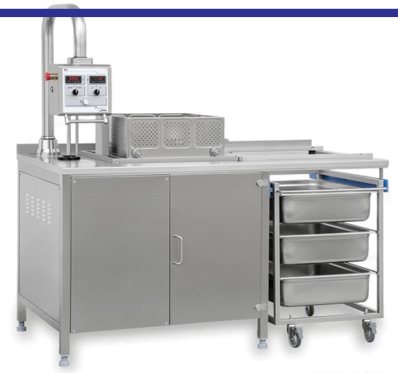
NILMA ΦΡΙΤΕΖΑ ΜΟΝΗ- ΔΙΠΛΗ ΜΕ ΠΡΟΓΡΑΜΜΑΤΙΣΜΟ ΡΕΥΜΑ - ΑΕΡΙΟ 80-80+80 lt