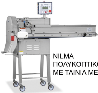
NILMA ΠΟΛΥΚΟΠΤΙΚΟ ΛΑΧΑΝΙΚΩΝ ΜΕ ΤΑΙΝΙΑ ΜΕΤΑΦΟΡΑΣ