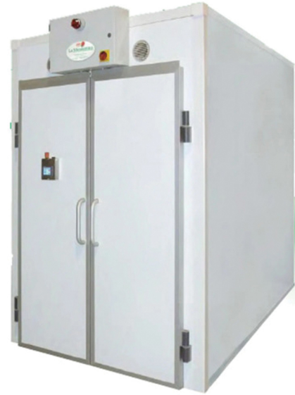
LA MINERVA ΞΗΡΑΝΤΗΡΙΟ ΖΥΜΑΡΙΚΩΝ 100-200-400-600 ΚΙΛΑ