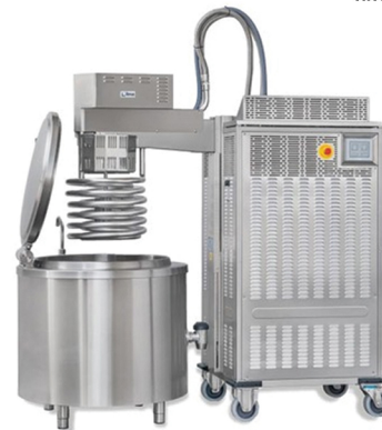
NILMA SPIRAL BLAST CHILLER ΓΙΑ ΨΥΞΗ ΥΓΡΩΝ