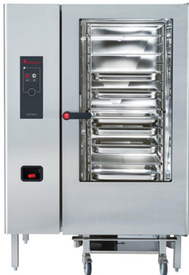
ELOMA MULTIMAX ΡΕΥΜΑ - ΑΕΡΙΟ ΤΑΨΙΑ: 20 X GN 2/1 ΑΥΤΟΜΑΤΟ ΠΛΥΣΙΜΟ