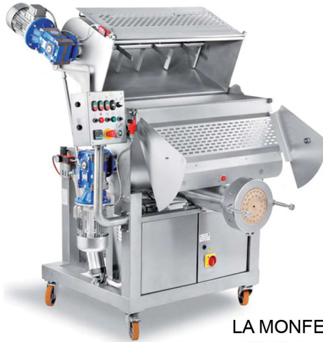
LA MONFERRINA ΜΗΧΑΝΕΣ ΖΥΜΑΡΙΚΩΝ ΠΑΡΑΓΩΓΗ 50-100-200 ΚΙΛΑ/ΩΡΑ