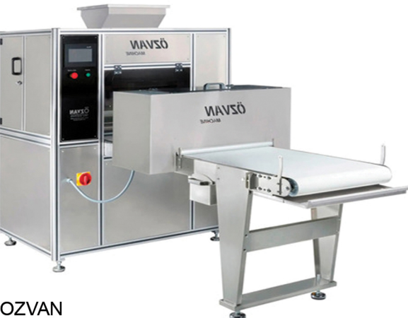
OZVAN ΑΥΤΟΜΑΤΟ ΜΗΧΑΝΗΜΑ ΦΥΛΛΟΥ ΜΠΑΚΛΑΒΑ