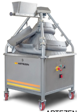
ARTEZEN ΚΩΝΙΚΟΣ ΣΤΡΟΓΓΥΛΟΠΟΙΗΤΗΣ