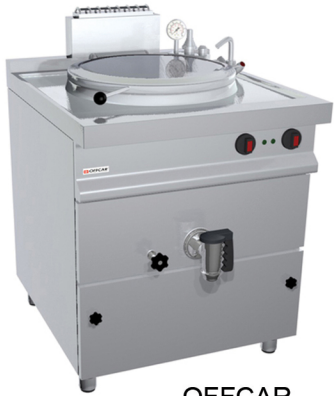
OFFCAR PEYMA - AERIO 100-150-200-300 It