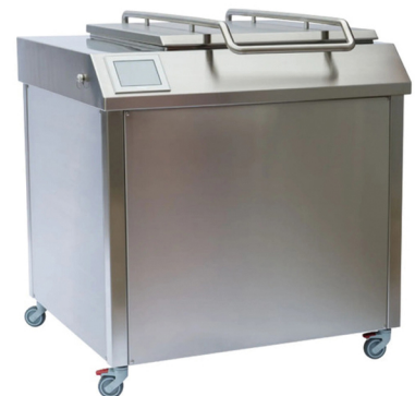
JOM SOUS VIDE ΜΕΓΑΛΗΣ ΧΩΡΗΤΙΚΟΤΗΤΑ 54, 126, 190, 250, 300, 380, 450, 500 ΚΙΛΑ