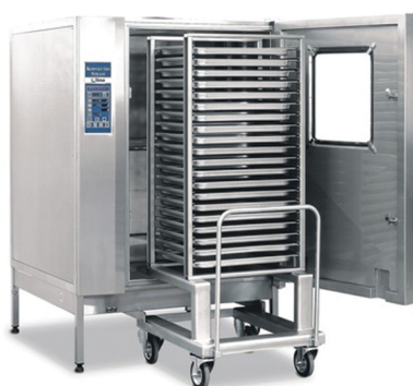
NILMA KONVEK ΡΕΥΜΑ-ΑΕΡΙΟ ΤΑΨΙΑ: 40 X GN 1/1