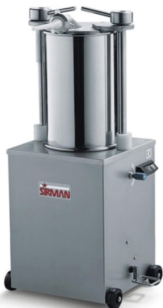
SIRMAN ΓΕΜΙΣΤΙΚΟ ΛΟΥΚΑΝΙΚΩΝ ΧΩΡΗΤΙΚΟΤΗΤΑ lt 15,25,35,50