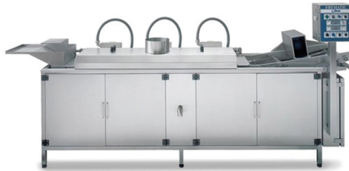
NILMA ΑΕΡΙΟΥ ΦΡΙΤΕΖΑ ΜΕ ΤΑΙΝΙΑ ΜΕΤΑΦΟΡΑΣ 160-290 lt