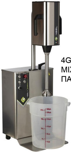
4GEL MIXER ΜΕΙΓΜΑΤΟΣ ΠΑΓΤΟΥ