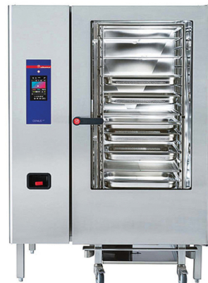
ELOMA GENIUS ΡΕΥΜΑ - ΑΕΡΙΟ ΤΑΨΙΑ: 20 X GN 2/1 ΑΥΤΟΜΑΤΟ ΠΛΥΣΙΜΟ