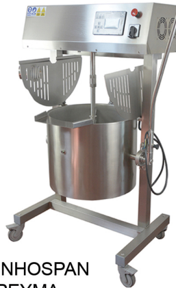
INHOSPAN PEYMA ME ANATROPHE ME ANAMEIHE 100 It