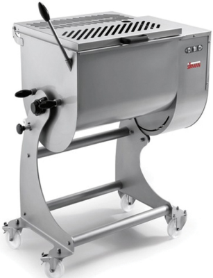
ΖΥΜΩΤΗΡΙΟ ΚΡΕΑΤΟΕΙΔΩΝ ΡΗΤΙΚΟΤΗΤΑ: 50-80-120-180 ΚΙΛΑ