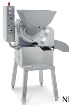
NILMA ΚΟΠΤΙΚΟ ΓΙΑ ΚΥΒΟΥΣ ΚΑΙ ΜΠΑΣΤΟΥΝΙΑ