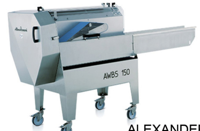
ALEXANDER SOLIA ΠΟΛΥΚΟΠΤΙΚΟ ΛΑΧΑΝΙΚΩΝ ΜΕ ΤΑΙΝΙΑ ΜΕΤΑΦΟΡΑΣ