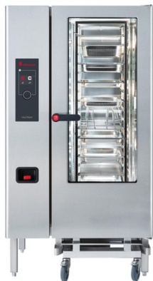
ELOMA MULTIMAX ΡΕΥΜΑ - ΑΕΡΙΟ ΤΑΨΙΑ: 20 X GN 1/1 ΑΥΤΟΜΑΤΟ ΠΛΥΣΙΜΟ