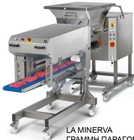
LA MINERVA ΓΡΑΜΜΗ ΠΑΡΑΓΩΓΗΣ ΜΕΡΙΔΩΝ