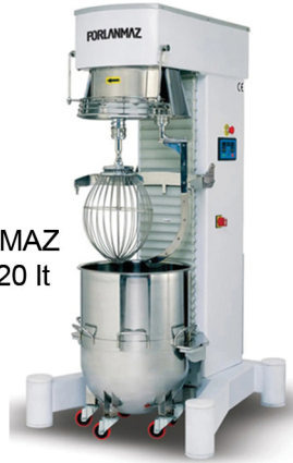
PORLANMAZ MIXER 120 lt