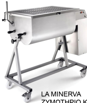
LA MINERVA ΖΥΜΩΤΗΡΙΟ ΚΡΕΑΤΟΕΙΔΩΝ ΧΩΡΗΤΙΚΟΤΗΤΑ: 30,50,90,120,180 ΛΙΤΡΑ