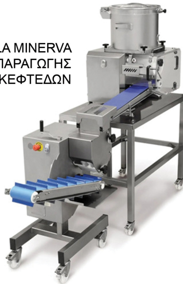
LA MINERVA ΓΡΑΜΜΗ ΠΑΡΑΓΩΓΗΣ ΚΕΦΤΕΔΩΝ