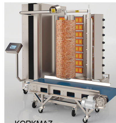
KORKMAZ ΜΗΧΑΝΕΣ ΓΥΡΟΥ ΡΟΜΠΟΤ