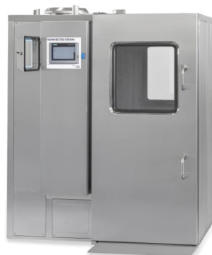
NILMA KSP 40 ΡΕΥΜΑ ΠΟΡΤΑ ΚΑΙ ΣΤΙΣ ΔΥΟ ΠΛΕΥΡΕΣ ΤΑΨΙΑ: 20 X GN 2/1