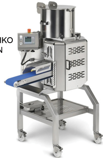
LA MINERVA ΦΟΡΜΑΡΙΣΤΙΚΟ ΜΠΙΦΤΕΚΙΩΝ