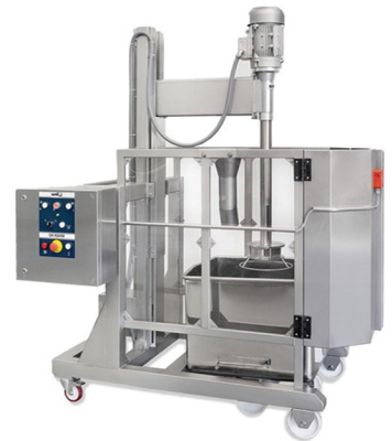
NILMA HD MIXER ΚΑΘΕΤΟ BLENDER