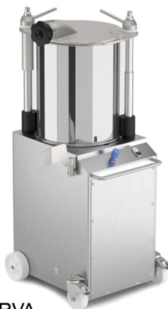
LA MINERVA ΓΕΜΙΣΤΙΚΟ ΛΟΥΚΑΝΙΚΩΝ ΧΩΡΗΤΙΚΟΤΗΤΑ lt 22,32,45