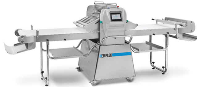
KMP AVANCINI ΑΥΤΟΜΑΤΕΣ ΣΦΟΛΙΑΤΟΜΗΧΑΝΕΣ