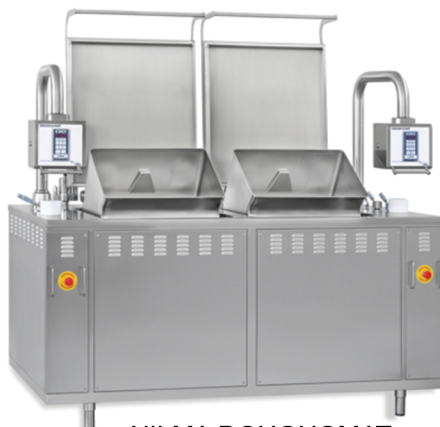
NILMA DOUGHOMAT ΡΕΥΜΑ - ΑΕΡΙΟ ΧΩΡΗΤΙΚΟΤΗΤΑ ΚΙΛΑ: 7+7 - 20+20