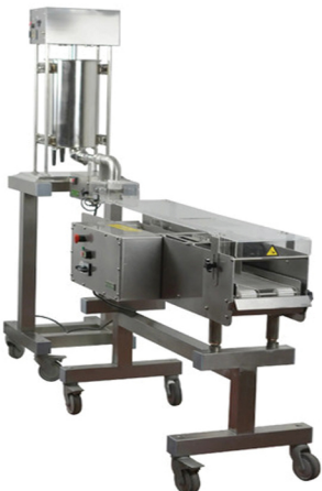
INHOSPAN ΑΥΤΟΜΑΤΗ ΜΗΧΑΝΗ ΠΑΝΑΡΙΣΜΑΤΟΣ ΚΡΟΚΕΤΩΝ