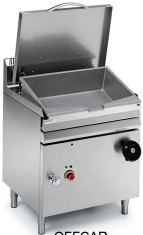
OFFCAR PEYMA-AERIO 80 It