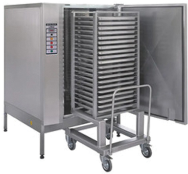
NILMA QUICK FROST ΓΙΑ 20 ΚΑΙ 40 ΤΑΨΙΑ GN 1/1