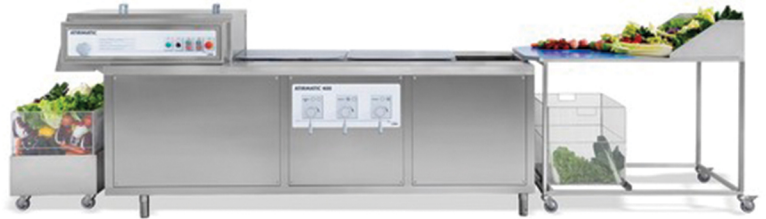
NILMA ATIR MATIC ΣΥΝΕΧΟΜΕΝΟ ΠΛΥΝΤΗΡΙΟ ΛΑΧΑΝΙΚΩΝ ΦΡΟΥΤΩΝ