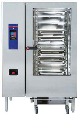
ELOMA GENIUS ΡΕΥΜΑ - ΑΕΡΙΟ ΤΑΨΙΑ: 20 X GN 1/1 ΑΥΤΟΜΑΤΟ ΠΛΥΣΙΜΟ