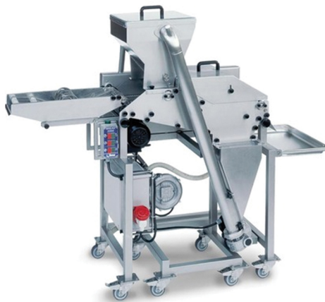
NILMA ΑΥΤΟΜΑΤΗ ΜΗΧΑΝΗ ΠΑΝΑΡΙΣΜΑΤΟΣ