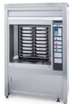
NILMA VAPHOOR ΦΟΥΡΝΟΣ ΑΤΜΟΥ ΡΕΥΜΑ-ΑΕΡΙΟ ΤΑΨΙΑ: 18 X GN 1/1