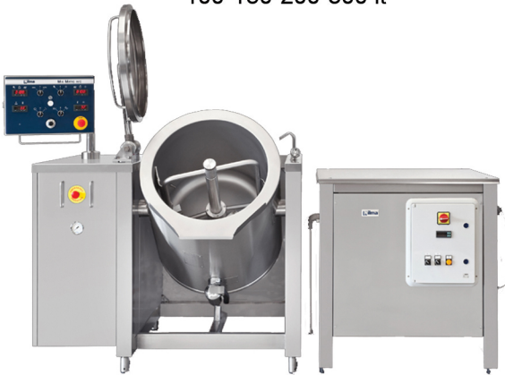
NILMA MIX-MATIC C PEYMA - ATMOS ME ANATROPHE-ME ANAMEIHE ME SYSTHMA PSYXHS 100-300 It