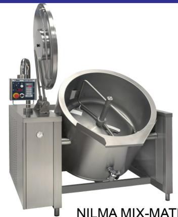
NILMA MIX-MATIC PEYMA - ATMOS ME ANATROPHE ME ANAMEIHE 150-300 It