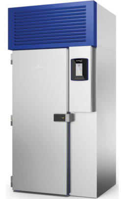
NORMANN NORTECH PLUS COOK & CHILL ΜΑΓΕΙΡΕΜΑ ΚΑΙ ΚΑΤΑΨΥΞΗ 20 ΤΑΨΙΑ GN 1/1