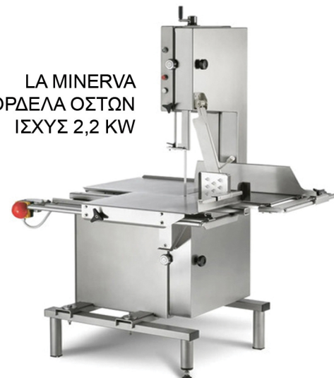
LA MINERVA ΠΡΙΟΝΟΚΟΡΔΕΛΑ ΟΣΤΩΝ ΙΣΧΥΣ 2,2 KW