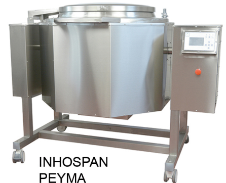
INHOSPAN PEYMA ME ANATROPHE ME ANAMEIHE 100-150-200 It