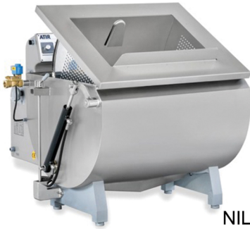
NILMA ATIR ΠΛΥΝΤΗΡΙΟ ΛΑΧΑΝΙΚΩΝ-ΦΡΟΥΤΩΝ ΧΩΡΗΤΙΚΟΤΗΤΑ 160,300,600 ΛΙΤΡΑ