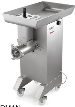
SIRMAN ΚΡΕΑΤΟΜΗΧΑΝΗ ΠΑΡΑΓΩΓΗ 1000 ΚΙΛΑ ΑΝΑ ΩΡΑ ΙΣΧΥΣ 7 ΙΠΠΟΥΣ