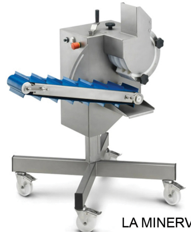
LA MINERVA ΦΟΡΜΑΡΙΣΤΙΚΟ ΚΕΦΤΕΔΩΝ