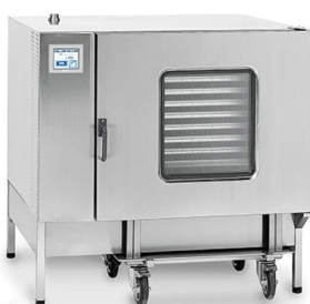
NILMA KONVEK ΡΕΥΜΑ-ΑΕΡΙΟ ΤΑΨΙΑ: 20 X GN 1/1