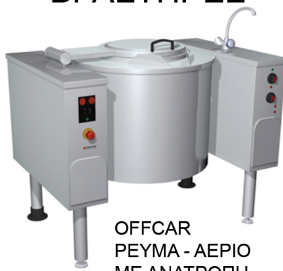
OFFCAR PEYMA - AERIO ME ANATROPHE 100-150-200-300 It