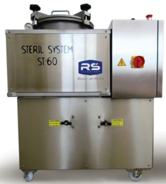
RS TECNOLOGIE ΑΠΟΣΤΕΙΡΩΤΗΣ ΒΑΖΩΝ