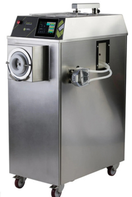
4GEL ΜΗΧΑΝΗΜΑ ΠΑΓΤΟΥ ΓΙΑ ΜΕΓΑΛΕΣ ΠΑΡΑΓΩΓΕΣ