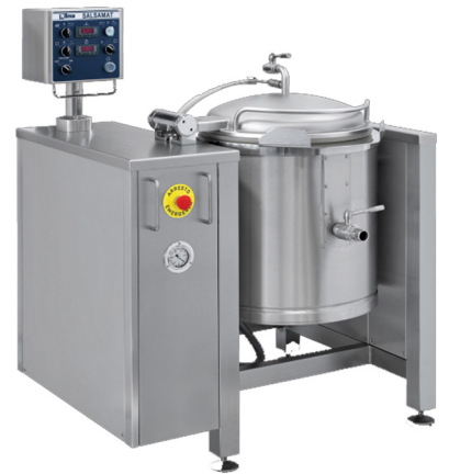
NILMA SALSAMAT SV PEYMA ME ANATROPHE-ME ANAMEIHE KAI ME VACUUM (EIDANIKO GIA MARMELADES) 40-80 It