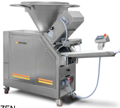
ARTEZEN ΟΓΚΟΜΕΤΡΙΚΟ ΔΙΑΧΩΡΙΣΤΙΚΟ ΖΗΜΗΣ