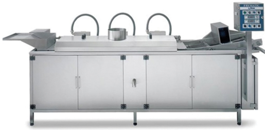
NILMA ΗΛΕΚΤΡΙΚΗ ΦΡΙΤΕΖΑ ΜΕ ΤΑΙΝΙΑ ΜΕΤΑΦΟΡΑΣ 100-230-430 lt