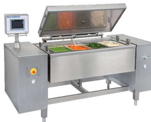
NILMA MULTIBRAT ATMOS ME ANATROPHE-PIESEW 250 It