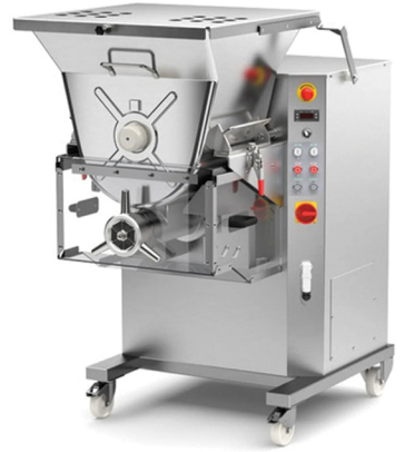
LA MINERVA ΚΡΕΑΤΟΜΗΧΑΝΗ ΚΑΙ ΑΝΑΜΟΙΞΗ ΠΑΡΑΓΩΓΗ 1500 ΚΙΛΑ ΑΝΑ ΩΡΑ ΙΣΧΥΣ 7+2.5 ΙΠΠΟΥΣ