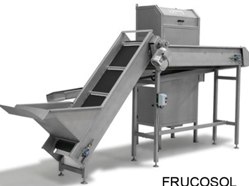
FRUCOSOL ΑΠΟΧΥΜΩΤΗΣ ΠΟΡΤΟΚΑΛΙΩΝ ΠΑΡΑΓΩΓΗ 180 ΦΡΟΥΤΑ/ΛΕΠΤΟ