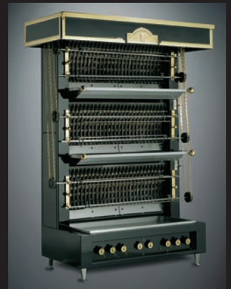
FLAMMENWAND-ROTISSERIE, TYP FF 36