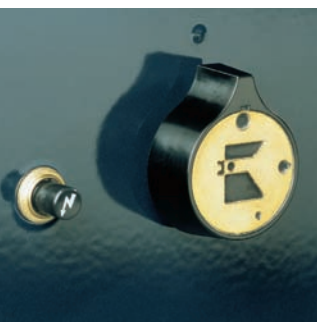
BEDIENUNGSELEMENTE IN MESSING FÜR GEHOBENES AMBIENTE.

UBERT has been manufacturing the Wall-of-Flame-Rotisseries and their unmistakable design for more than 40 years now. The principle, that design normally changes over the decades has been intentionally disregarded in this case. This line of nostalgic rotisseries has its own community of customers and they are looking exactly for this particular and old-fashioned type of design. The fact that these rotisseries work on open fire harmonises with the archaic look of the units. The chain drive, the cast iron gills, the fittings - all these details underline the character of these rotisseries. But still the customer can influence the design of the machines himself by choosing from several enamel colourings. The spectrum ranges from black, over dark blue to white. The fittings and chains are available in chrome, brass or copper.