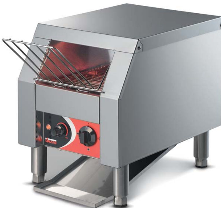
TOSTÌ 18 VV