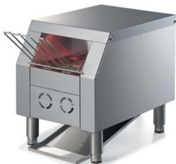
Protezione comandi opzionale Optional controls protection