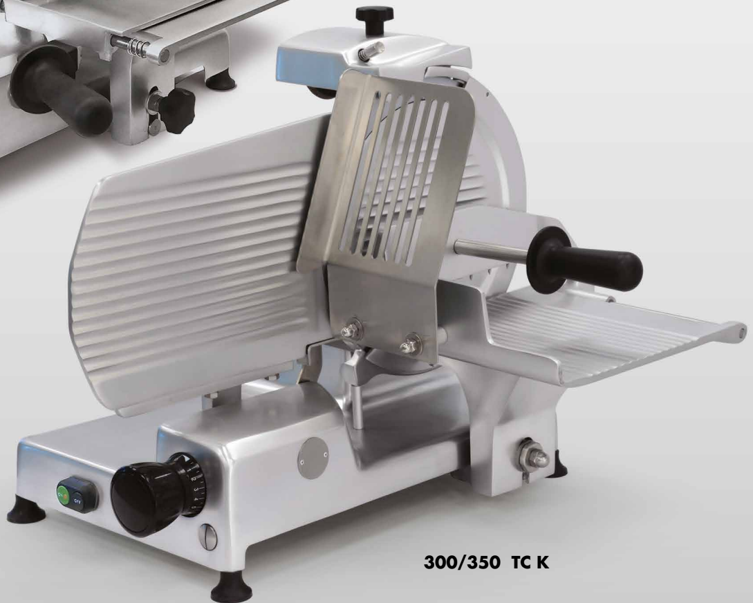
300/350 TC K