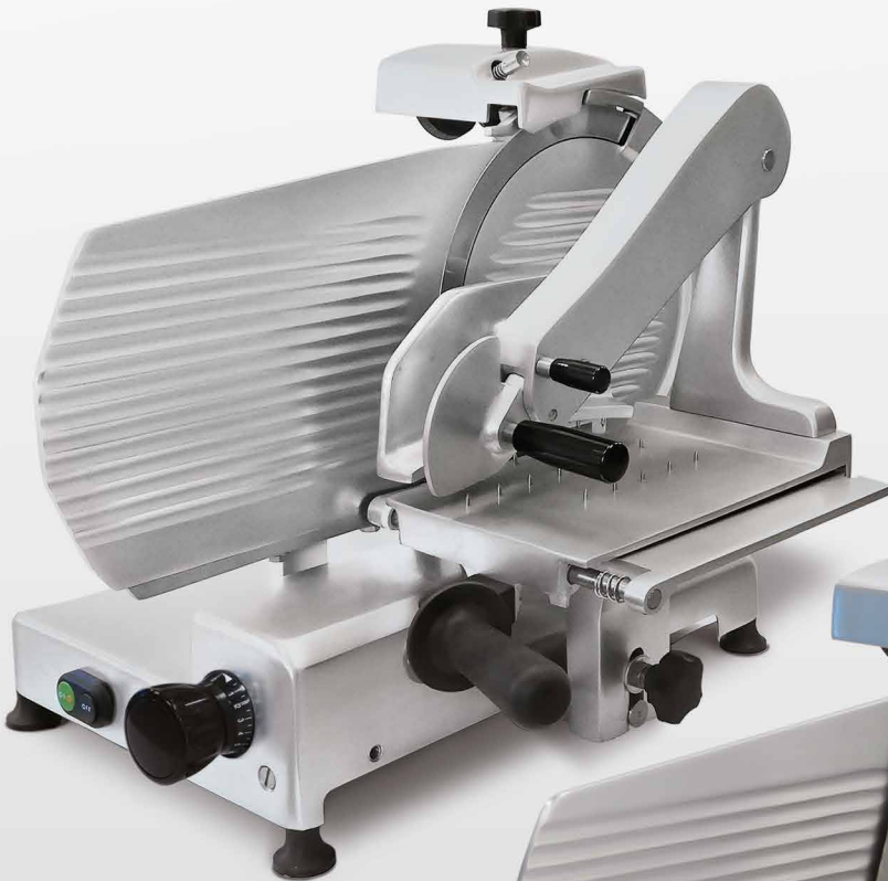
300/350 TS K