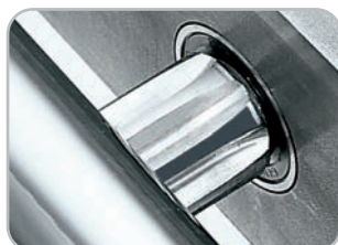
Scorrimento su cuscinetti Running on ball bearings