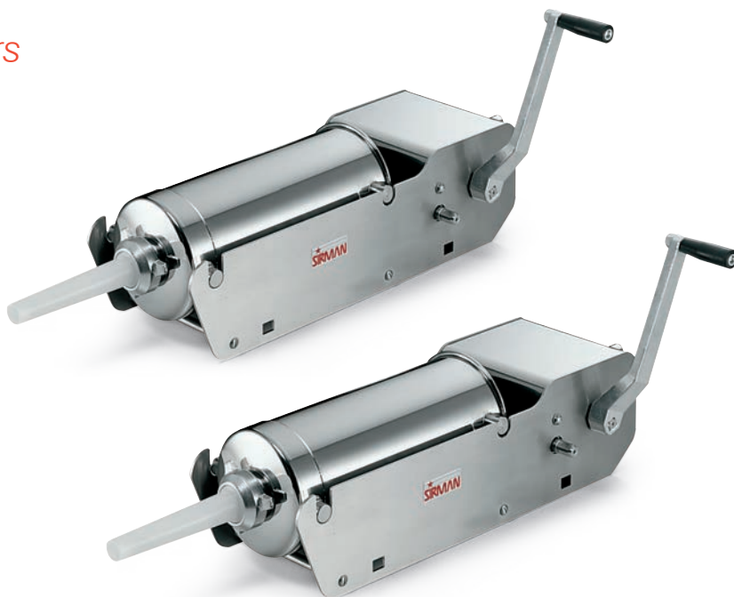
IS 8-16 ARIES