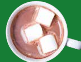
CIOCOLATA IN TAZZA HOT CHOCOLATE CUPS