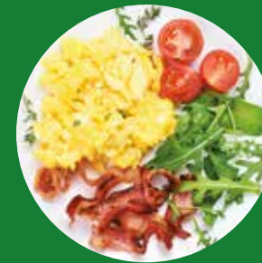
UOVA STRAPAZZATE SCRAMBLED EGGS