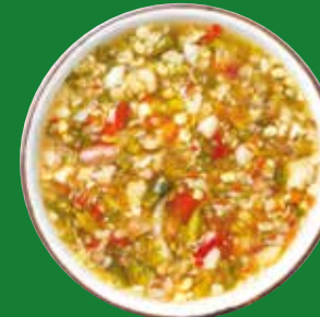
ZUPPE E VELLUTATE SOUPS AND CREAM