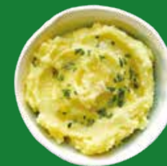
PURÈ MASHED POTATOES