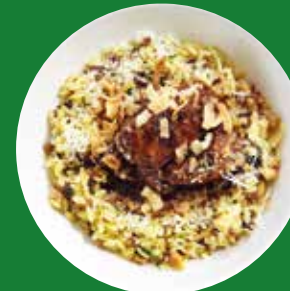
RISOTTI ITALIAN RISOTTI