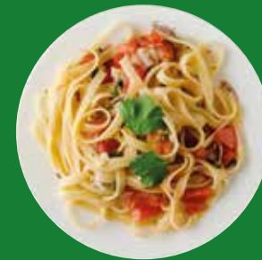
PASTA ITALIAN PASTA